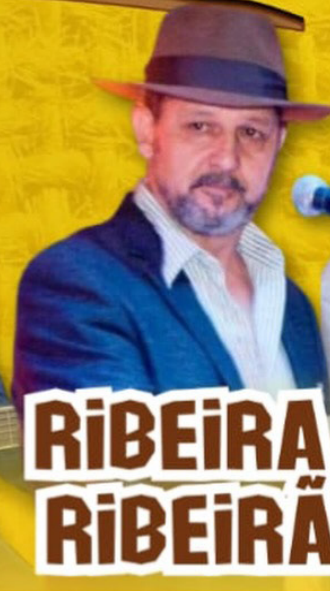
RIBEIRA E RIBEIRÃO