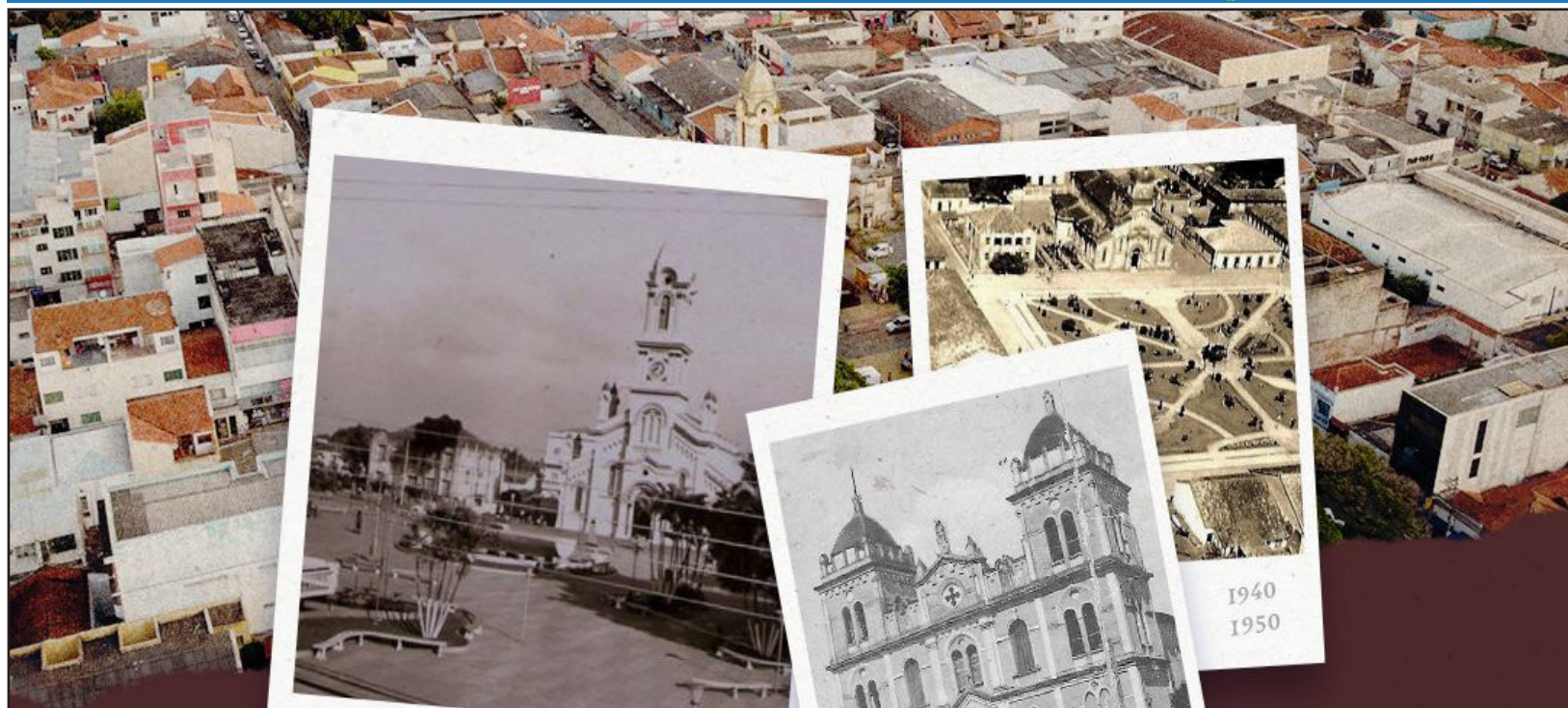
Praça Rui Barbosa - 1930