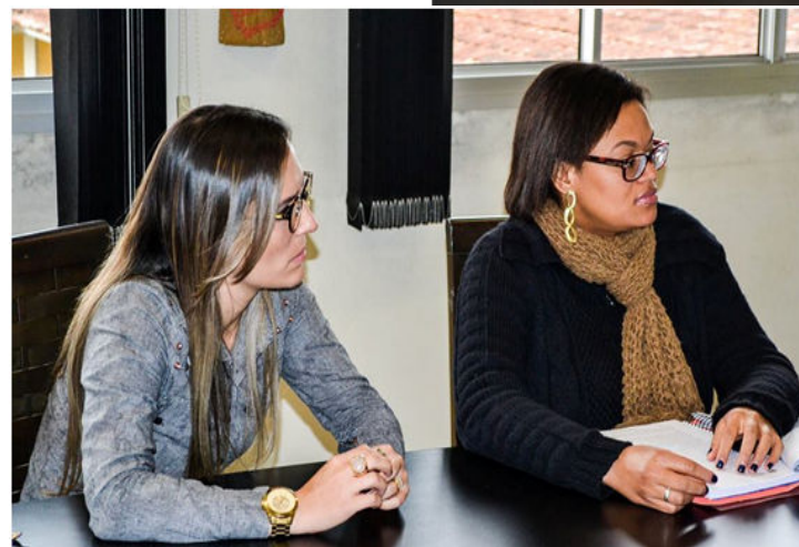
Relatório de Atividades de 2014 do Projeto Guri foi apresentado durante reunião