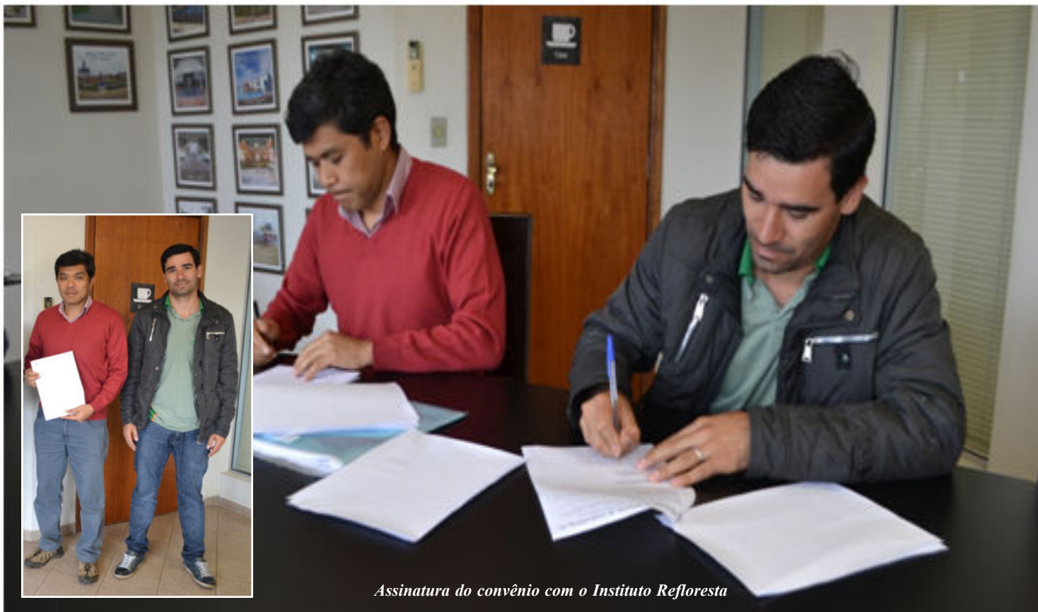
Assinatura do convênio com o Instituto Refloresta

Para o Governo Municipal, o convênio é mais uma ação positiva para intensificar a preservação ambiental e liderança no ranking do Programa Município Verde Azul de Capão Bonito na região sudoeste.