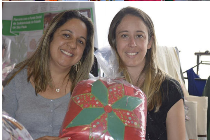
FSS de Capão Bonito marcou presença na reunião de trabalho com a primeira-dama Lu Alckmin em Taquarituba