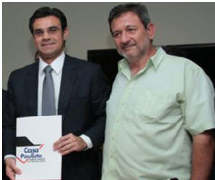
A assinatura da autorização durante audiência

Para a FETAESP – Federação dos Trabalhadores na Agricultura do Estado de São Paulo, a Casa Paulista já havia liberado anteriormente R$ 12,3 milhões, equivalente a 1.234 casas rurais, nos municípios de Apiaí, Barão de Antonina, Barra do Chapéu, Bom Sucesso de Itararé, Capão Bonito, Coronel Macedo, Guareí, Itaberá, Itaóca, Itapeva, Itaporanga, Itararé, Nova Campina, Parapanema, Piedade, Quadra, Ribeirão Branco, Ribeirão Grande, Riversul e Taquarivaí.