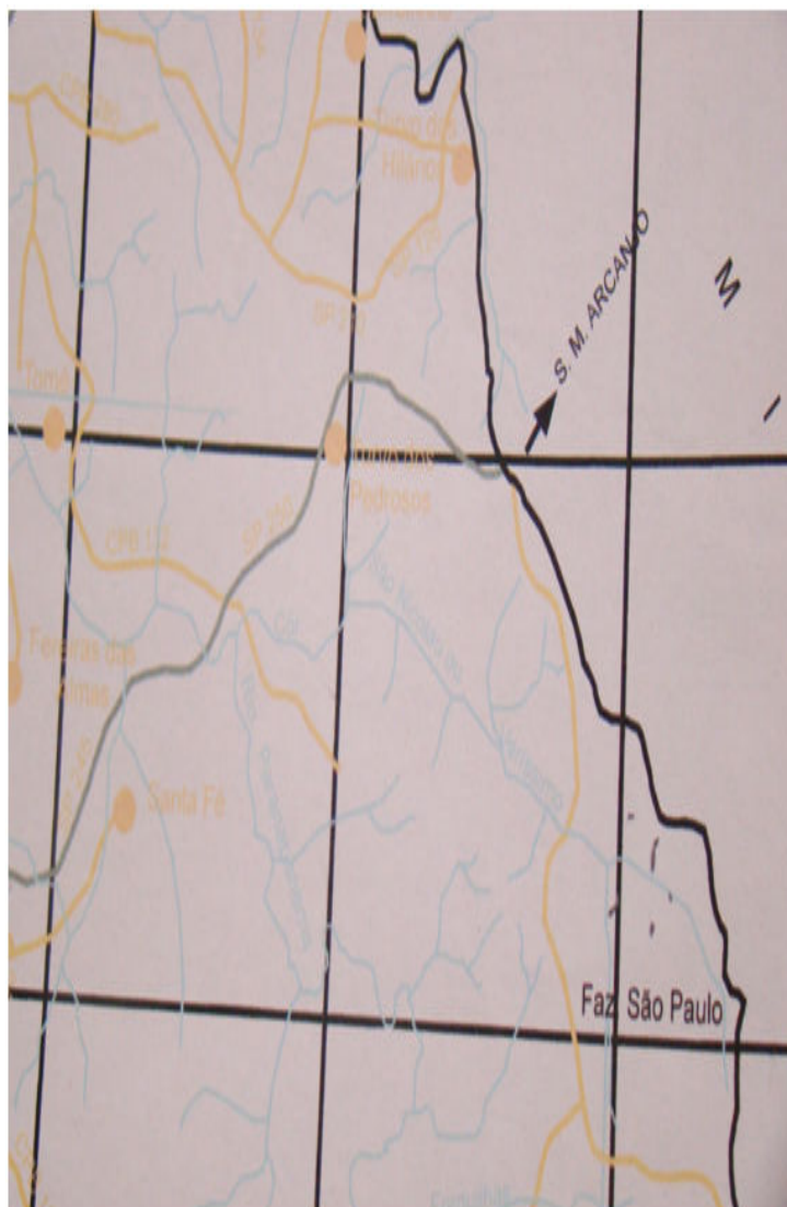
Bairro São-paulinho foi incluído em mapas pelo IGC

Para a Administração Municipal a inclusão do bairro é importante, pois regulariza a abrangência da extensão territorial do município facilitando os estudos de georreferenciamento.