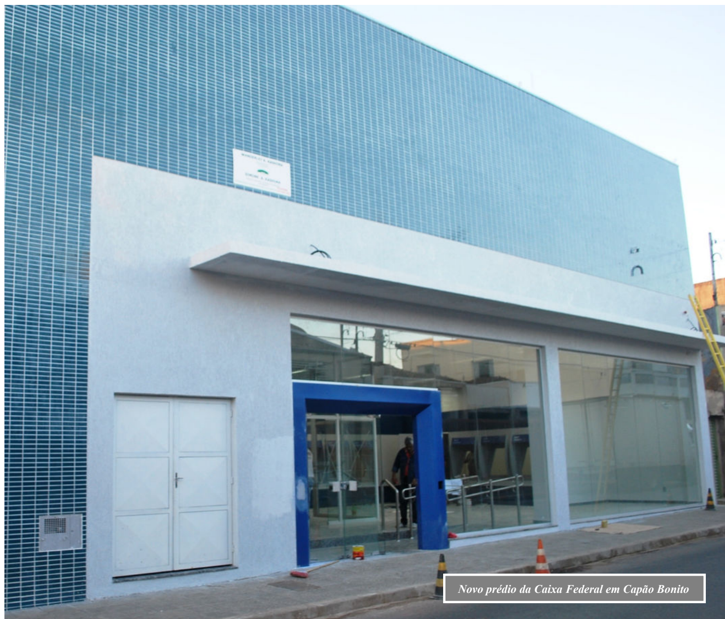
Novo prédio da Caixa Federal em Capão Bonito

O gerente ainda destacou que o novo prédio foi construído e planejado para ampliar o número de atendentes e de terminais de autoatendimento. Atualmente, a Caixa Econômica Federal de Capão Bonito possui um quadro pessoal de 18 funcionários, sendo 14 com vínculos diretos e outros quatro terceirizados, esses responsáveis pelos serviços de vigilância e segurança.