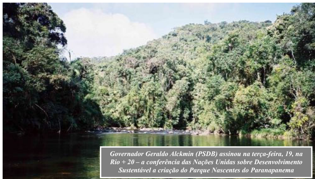
Governador Geraldo Alckmin (PSDB) assinou na terça-feira, 19, na Rio + 20 – a conferência das Nações Unidas sobre Desenvolvimento Sustentável a criação do Parque Nascentes do Paranapanema

Calcula-se a existência de apenas 250 indivíduos entre os Estados do Paraná, São Paulo e Rio de Janeiro, a maioria na área do mosaico. O levantamento da fauna mostrou a presença de 50 espécies ameaçadas de mamíferos, entre eles o cachorro do mato-vi-nagre e o veado-bororó, o cervídeo mais raro do Brasil, e 450 de aves, uma das maiores diversidades do mundo.