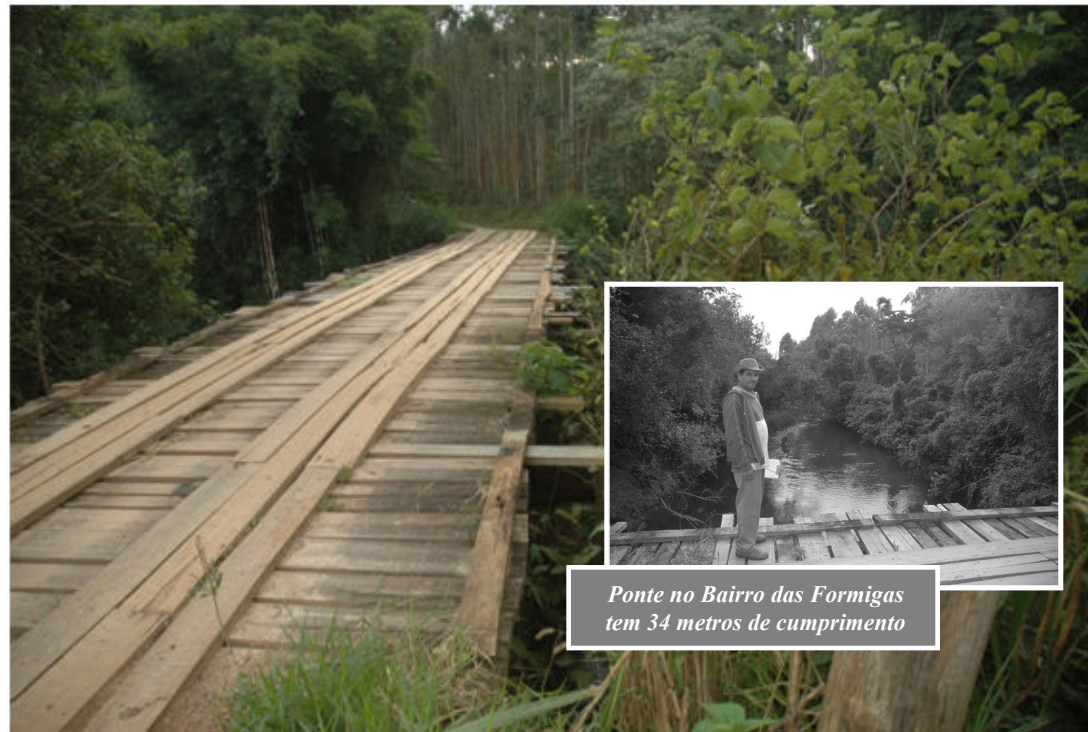
Ponte no Bairro das Formigas tem 34 metros de comprimento

De acordo com levantamento da Secretaria de Obras, a cidade tem mais de 110 pontes e nos últimos anos através de par-