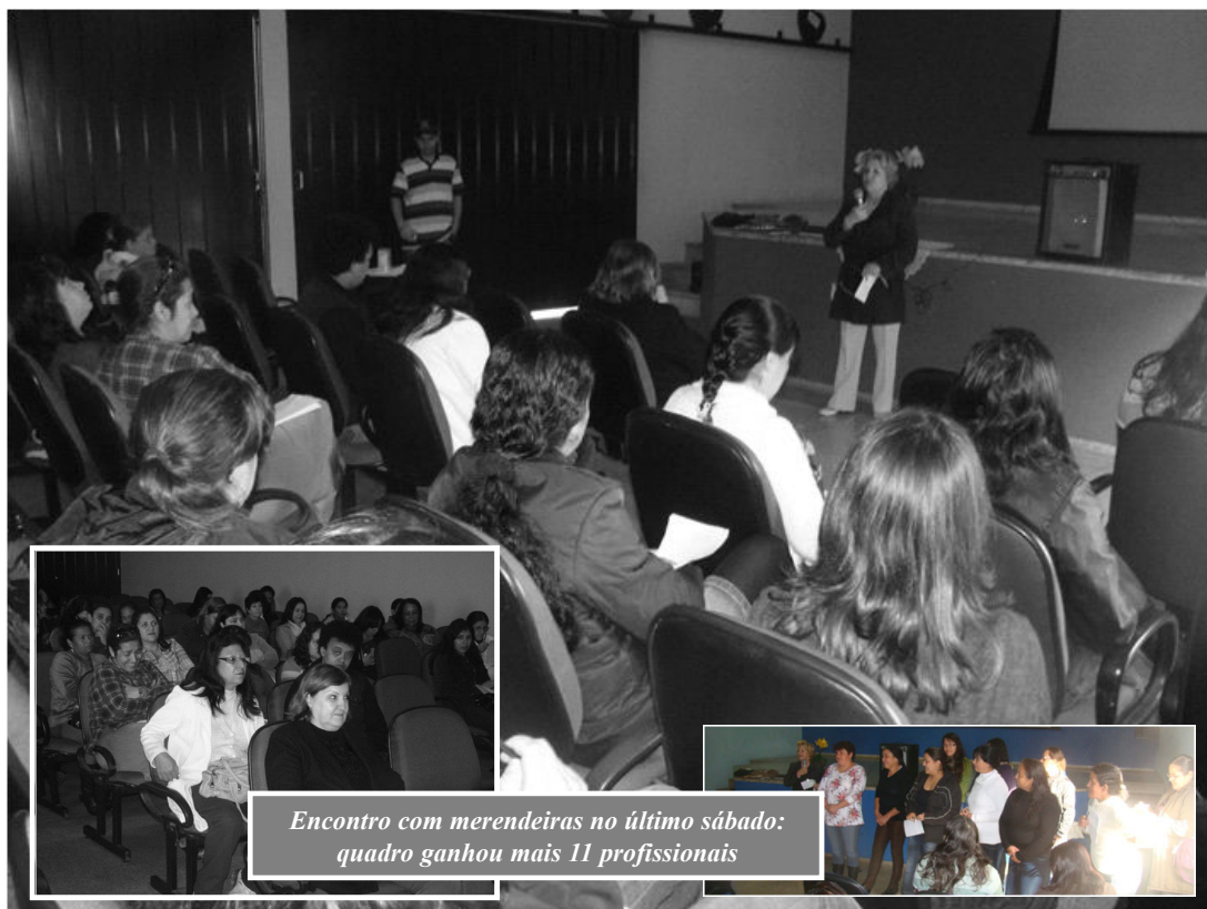
Encontro com merendeiras no último sábado: quadro ganhou mais 11 profissionais

Capão Bonito passou a ter um quadro de 86 merendeiras.