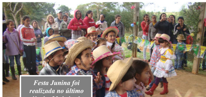
Festa Junina foi realizada no último sábado, 23 de junho

A direção e coordenação das escolas agradecem o empenho dos alunos, professores, colaboradores, funcionários, monitores e pais na realização da festa.