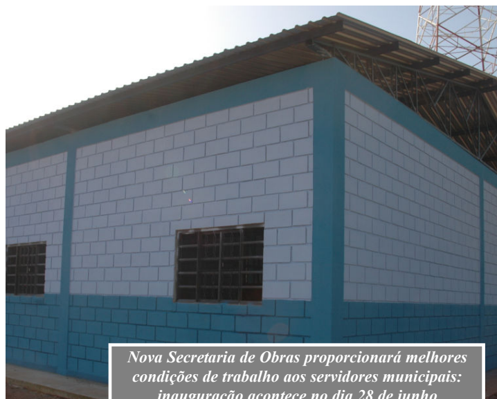
Nova Secretaria de Obras proporcionará melhores condições de trabalho aos servidores municipais: inauguração acontece no dia 28 de junho

Com a mudança, além de economizar uma quantia estimada em mais de R$ 170 mil só em aluguel o governo municipal trouxe a secretaria para perto da população e dos funcionários.