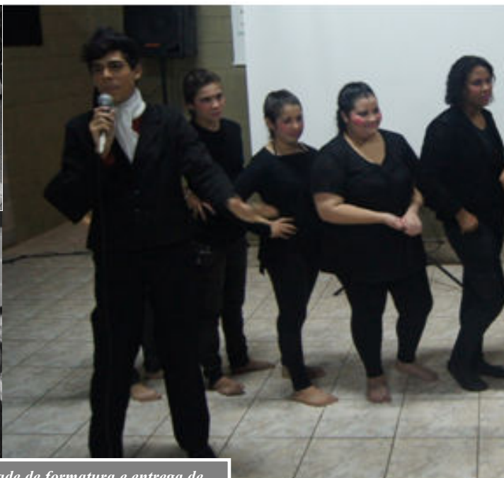
Solenidade de formatura e entrega de certificados no último dia 20 de junho