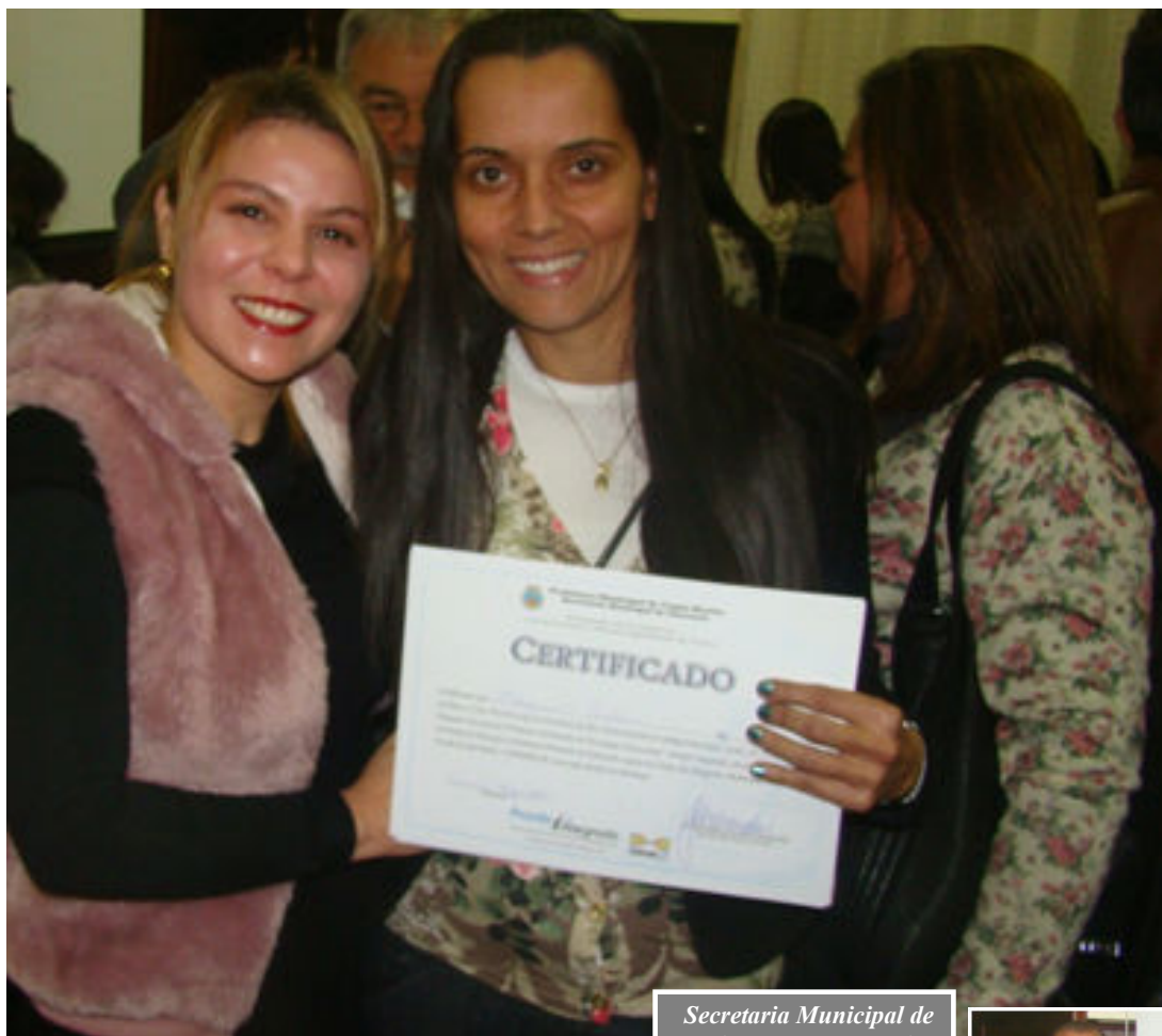
Secretaria Municipal de Educação entregando certificados na noite da última segunda-feira

Agradecemos as empresas parceiras pela colaboração prestada a este evento sendo: UNISA DIGITAL, Constroí – EPP.