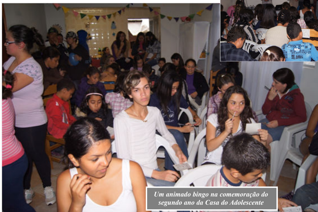
Um animado bingo na comemoração do segundo ano da Casa do Adolescente

“A adolescência é um período muito conturbado, em que as mudanças psicológicas e físicas trazem uma nova visão de mundo, alteram-se os papéis social e familiar, inclusive porque tem início a vida sexual, que vem acompanhada de novas preocupações pessoais, como a formação escolar, a preparação para os vestibulares e o futuro profissional. Por isso, uma atenção especializada é essencial para dar um suporte psicológico diante de tantas dúvidas e ansiedades dessa turma que já não é mais criança, mas ainda não se tornou adulta”, destacou o governo municipal.