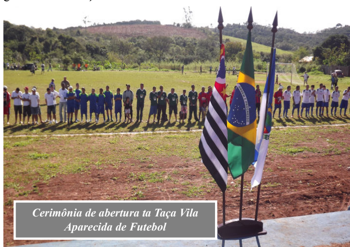
Cerimônia de abertura ta Taça Vila Aparecida de Futebol

A rodada de amanhã terá três jogos - às 11 horas: Ajax x Aparecidense, às 12h30: Atlético Bela Vista A x Ruinha e às 14 horas: Colorado x SIMI.