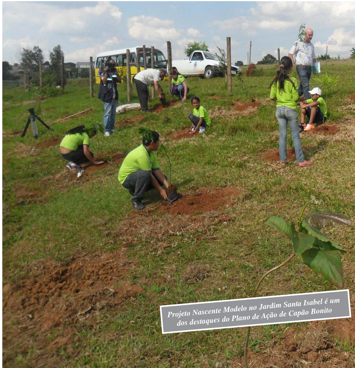
Projeto Nascente Modelo no Jardim Santa Isabel é um dos destaques do Plano de Ação de Capão Bonito