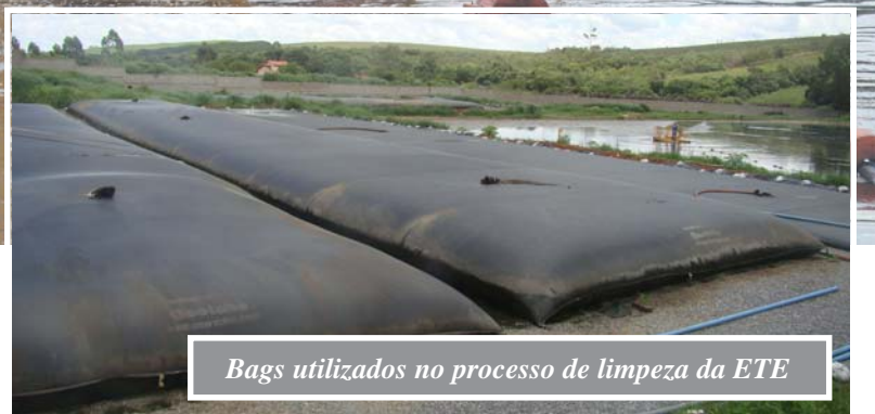
Bags utilizados no processo de limpeza da ETE