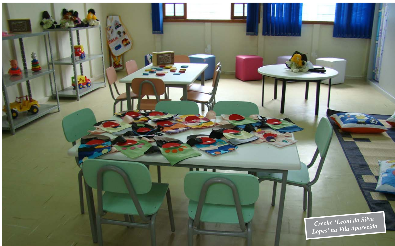
Creche 'Leoni da Silva Lopes' na Vila Aparecida