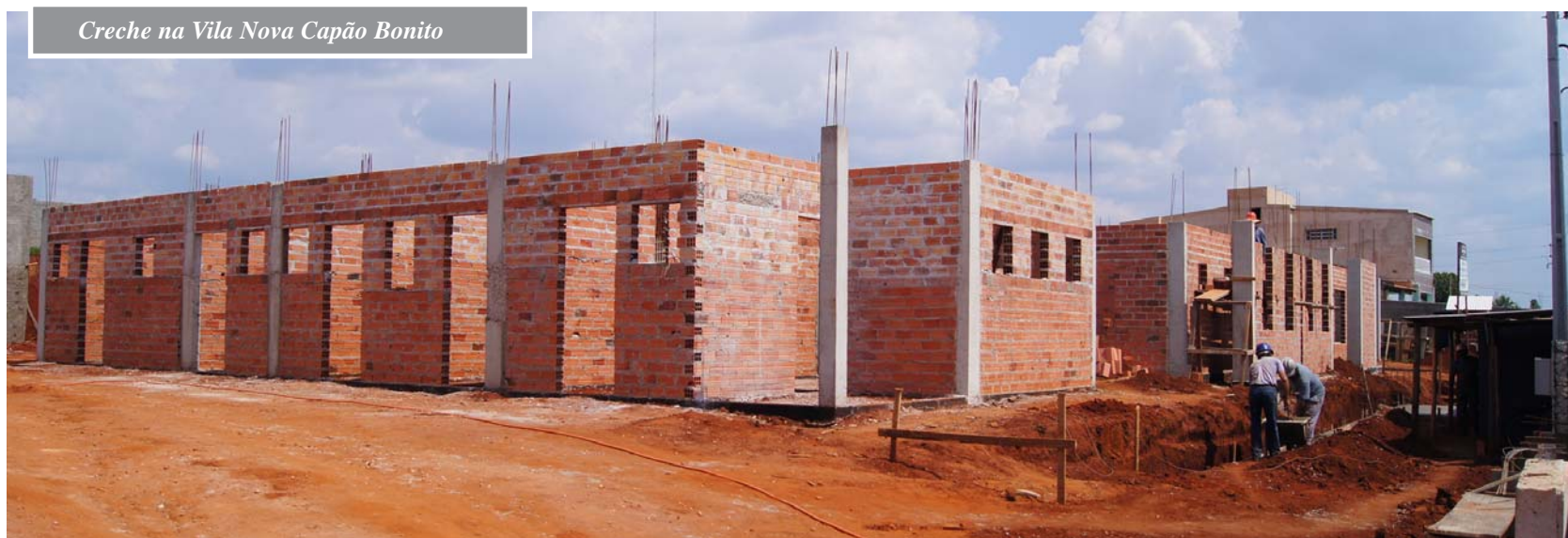
Creche na Vila Nova Capão Bonito