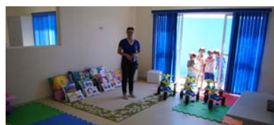
Salas projetadas para atender melhor os alunos