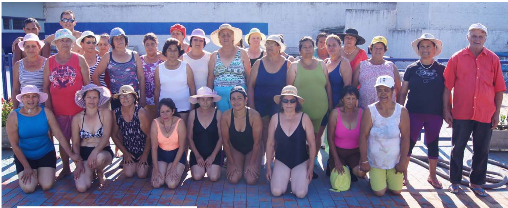
Aula de hidroginástica na última terça-feira

Caso haja mais idosos interessados, novas turmas serão criadas.