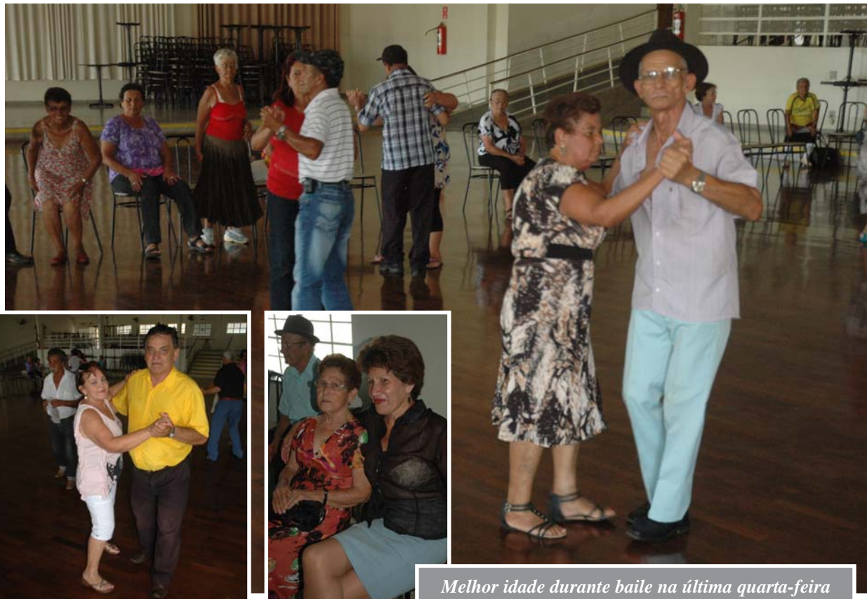
Melhor idade durante baile na última quarta-feira

“É uma atividade que traz satisfação pessoal, todos gostam”, afirmaram idosos ouvidos durante os bailes.