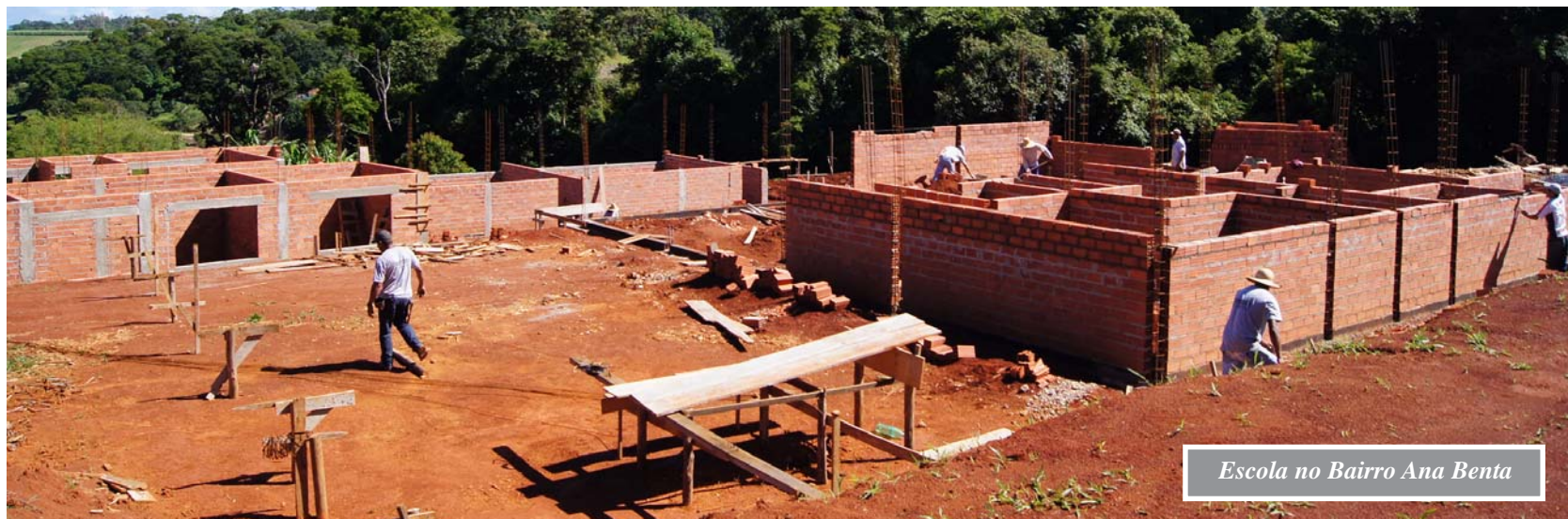
Escola no Bairro Ana Benta