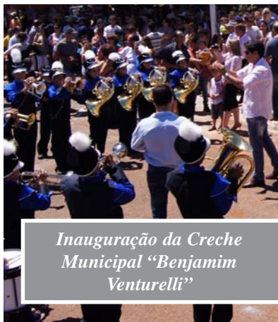
Inauguração da Creche Municipal “Benjamim Venturelli”

As matrículas foram feitas antecipadamente no ano passado. “Estaremos entregando em março a Creche Anair Bestel na Vila Aparecida. As creches do Jardim Alvorada e Nova Capão Bonito também estão em fase adiantada, além da escola do Bairro Ana Benta. Ainda neste primeiro semestre queremos acelerar a construção das creches da Vila Maria, do Jardim Boa Esperança, além de uma escola no Bairro Nova Capão Bonito”, acrescentou a prefeita.