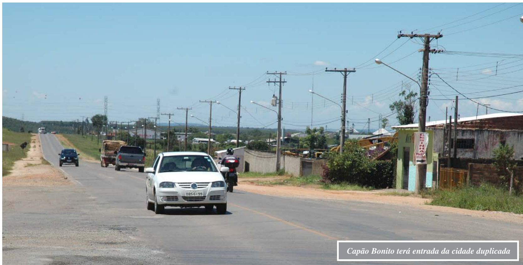
Capão Bonito terá entrada da cidade duplicada

Tomada de preços publicada no último dia 24 de janeiro no Diário Oficial do Estado