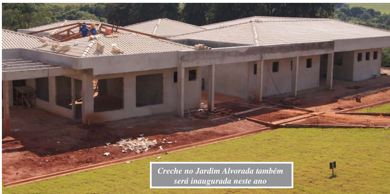
Creche no Jardim Alvorada também será inaugurada neste ano

Analisados de uma perspectiva histórica, os números de acesso a creches no Brasil têm crescido – há uma década, apenas 10% estavam matriculados. Entretanto, o