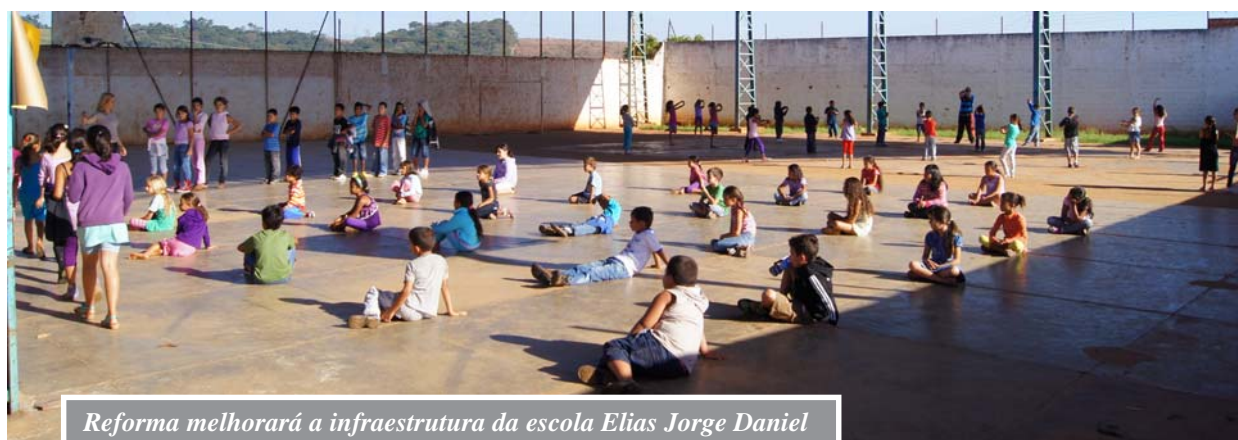
Reforma melhorará a infraestrutura da escola Elias Jorge Daniel

O governo municipal também tem projeto de construção de creches para atender aos bairros Vila Maria e Jardim Boa Esperança, além de reforma e adequação da E.M. “Jornalista José Carlos Tallarico”, E.M. “Isolina Leonel Ferreira”, E.M. “Creche Anair da Aparecida Miguel Bestel” ( em fase de conclusão ), E.M. “Recanto Maria Lírio Tallarico” ( em andamento ), E.M. “Profª. Maria da Conceição Lucas Mieldazis”, E.M. “Professora Jacyra Landim Stori (projeto sendo elaborado), E.M. “Oscar Kurtz Camargo” e E.M. “Gov. André Franco Montoro (Turvo dos Almeidas - em andamento ) e E.M. “Angelino Sudário de Souza (Bairro dos Proenças).