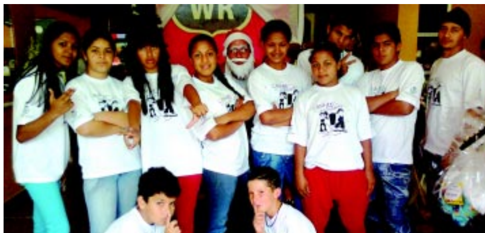
Grupo de dança da Casa do Adolescente

co agradecer a todos que contribuíram de forma direta ou indireta, para a realização desses e demais eventos realizados durante o ano de 2010, sendo possível a realização dos sonhos de muitos jovens de nossa cidade, conseguindo mostrar para eles o caminho do verdadeiro amor de um semelhante para com o outro.