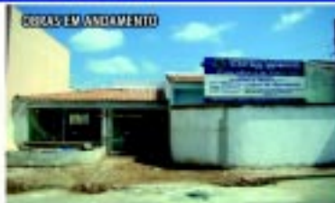
Novo Centro de Fisioterapia

PREFEITURA DO MUNICÍPIO DE CAPÃO BONITO Planejando o futuro, transformando o presente