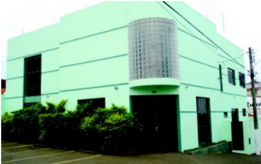
Imóvel onde funcionará o Centro de Atendimento Multifuncional Pedagógico (CAMP); inauguração acontecerá no dia 12 de fevereiro

O CAMP deve funcionar nos períodos matutino (7:30 às 11:30 horas) e vespertino (13 às 17 horas), que acontecerá de segunda a quinta-feira, e na sexta-feira os profissionais poderão ficar a disposição dos gestores, professores, para orientações e palestras. A equipe multidisciplinar será constituída por uma psicóloga, uma fonoaudióloga e um médico pediatra/clínico.