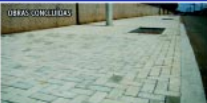
Calçada na Escola Municipal Maria da Conceição Lucas Meidazis