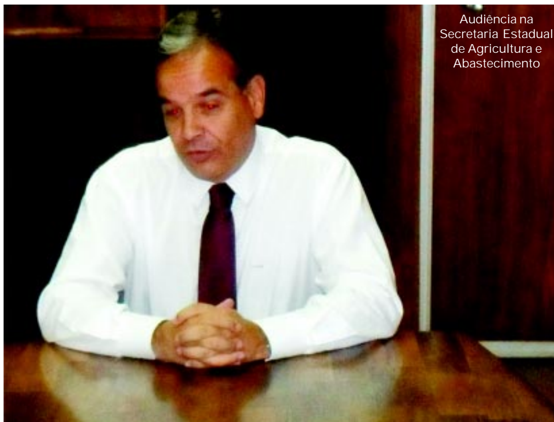
Audiência na Secretaria Estadual de Agricultura e Abastecimento

“O programa já garantiu a recuperação de quase 50 pontes em vários bairros da cidade. Somos o quinto em extensão territorial do Estado, com mais de 4.000 km de estradas e acessos”, frisou o governo municipal que espera que os pedidos sejam atendidos neste ano.