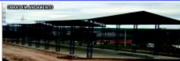
Nova Secretaria Municipal de Obras Investimento de mais de R$ 1 milhão (recursos próprios)