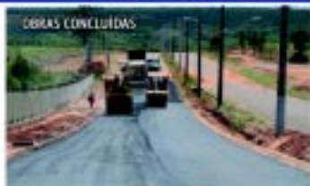
Pavimentação do acesso à Fatec/ETEC