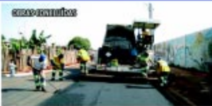
Asfaltamento da rua Pedro Gonçalves de Almeida na Vila Aparecida