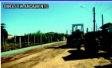
Início das Obras de Pavimentação Jardim Alvorada