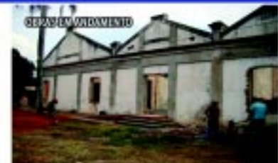
Obras do Projeto Quero Vida futuras instalações do Centro de Convivência do Idoso