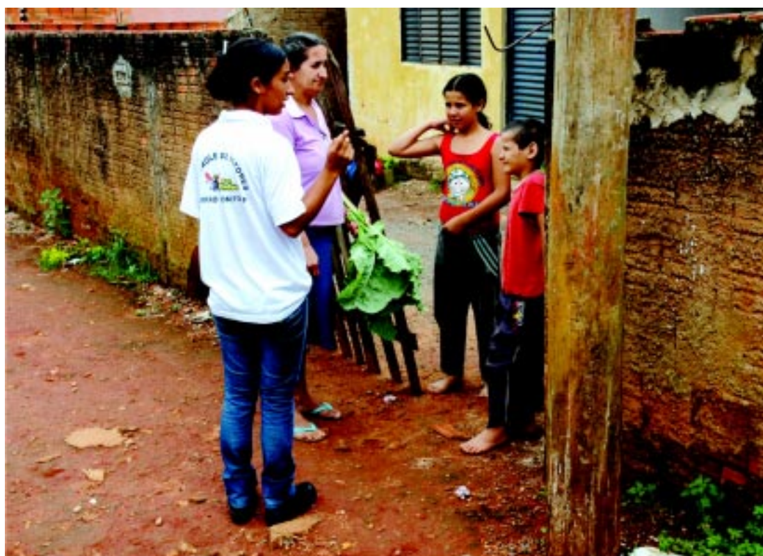
Combate a dengue na Vila Aparecida na última quinta-feira