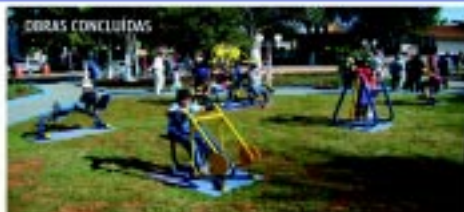
Praça do Cruzeiro reurbanizada