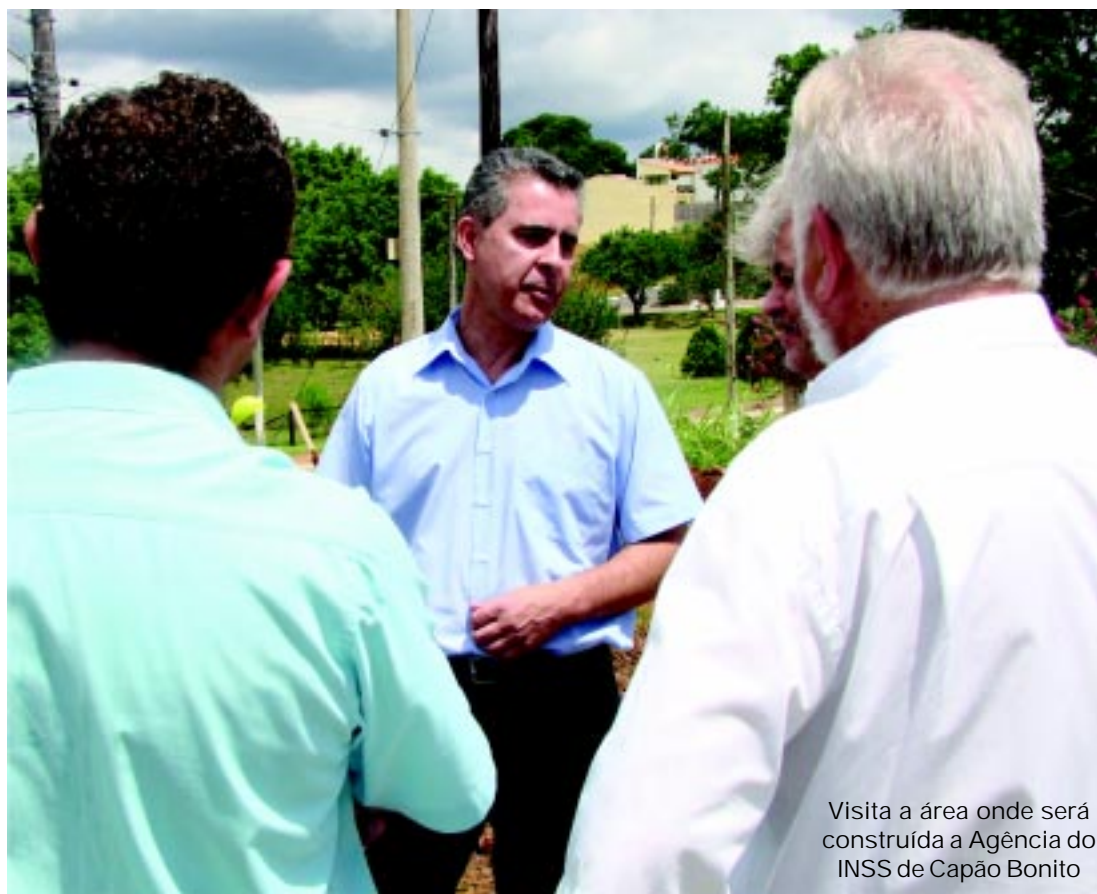
Visita a área onde será construída a Agência do INSS de Capão Bonito

“A agência em Capão Bonito evitará que um grande número de capão-bonitenses tenha que se deslocar até Itapetininga. Além disso gerará empregos durante o processo de edificação e quando estiver funcionando”, destacou o governo municipal.