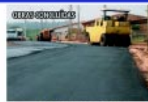
Asfaltamento na Vila Nova Capão Bonito