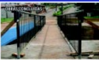
Ponte Jardim Europa