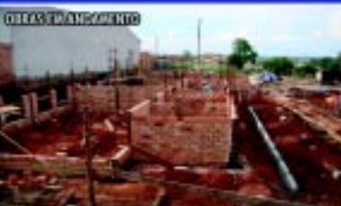
Nova creche do Jardim Europa investimento de mais de R$ 600 mil