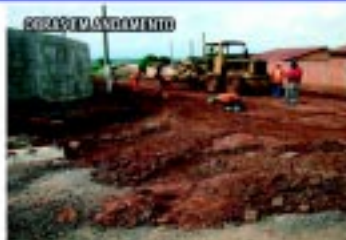
Conclusão de pavimentação no Jardim Europa