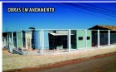
Centro de Atenção à Mulher