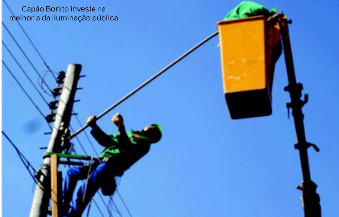
Capão Bonito investe na melhoria da iluminação pública

O cronograma de inauguração ficou definido da seguinte forma pela administração: Bairro Ana Benta – 27 luminárias – inauguração no dia 21 às 19 horas.