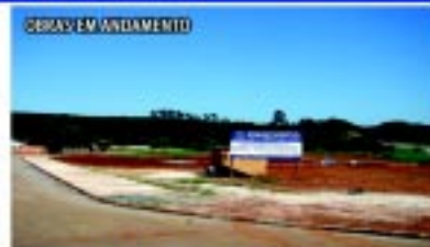
Nova Praça do Jardim São Francisco