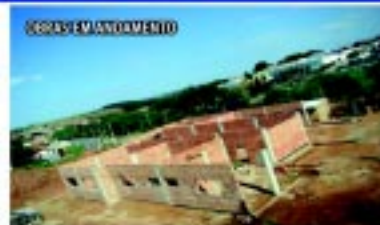
Nova Vila do Trabalho