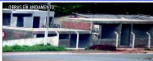
Nova Unidade Básica de Saúde da Vila Aparecida