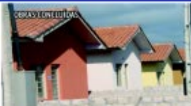
Entrega de 79 casas nos Conjuntos Habitacionais Boa Esperança e Jardim da Amizade