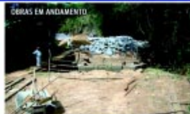
Nova ponte beirto Água Quente