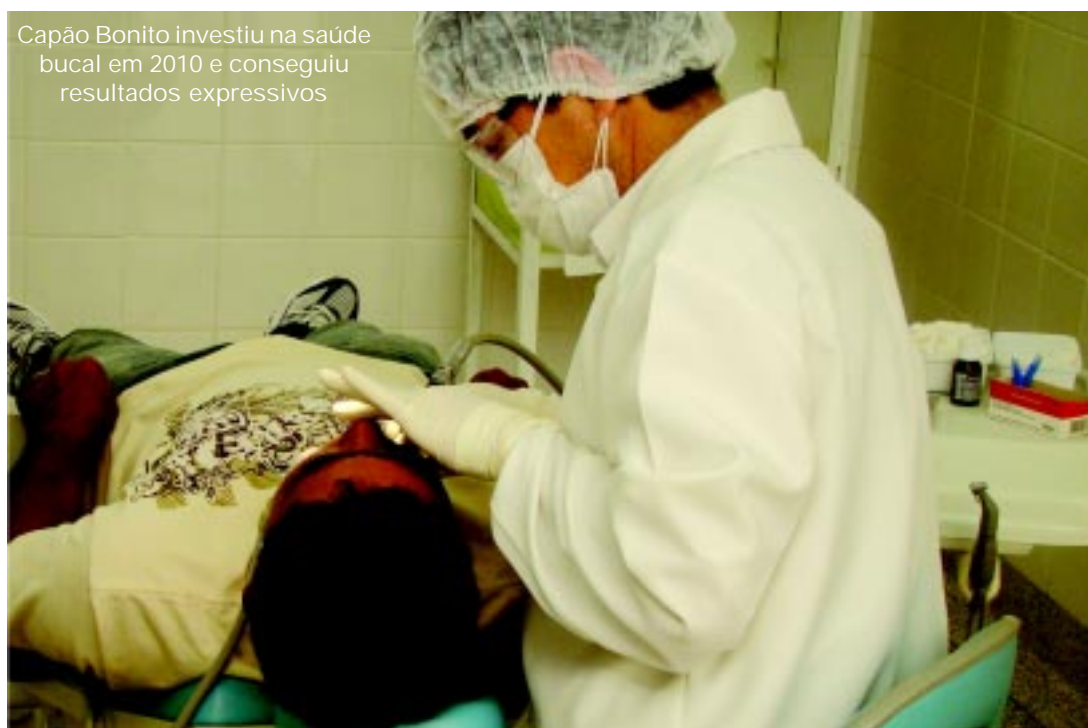
Capão Bonito investiu na saúde bucal em 2010 e conseguiu resultados expressivos

Para 2011 foram feitos investimentos no atendimento da zona rural com a aquisição de um veículo para transporte da equipe exclusivo da odontologia e ampliação da atenção aos menores de 5 anos.