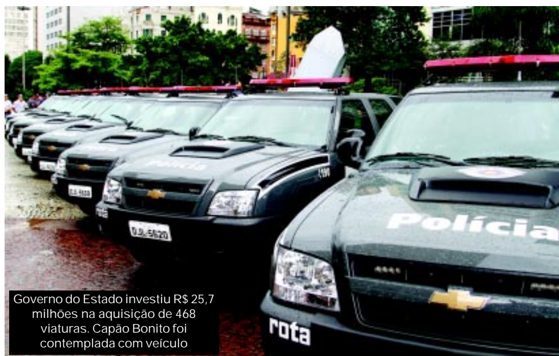
Governo do Estado investiu R$ 25,7 milhões na aquisição de 468 viaturas. Capão Bonito foi contemplada com veículo

Sorocaba - A região terá mais 32 viaturas - 12 Blazers e 20 Gols -, para os municípios de Sorocaba, Botucatu, Itapetininga, Cerquillo, Guaré, Tatuí, Votorantim, Ibiúna, Iperó, Piedade, Salto de Pirapora, Itu, Porto Feliz, Salto, São Roque, Avaré, Iaras, Piraju, Itapeva, Apiaí, Capão Bonito e Itararé.