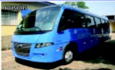
Mais de 50 veículos adquiridos na atual gestão