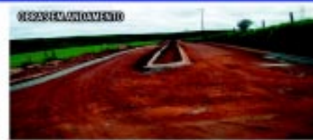
Início da pavimentação do acesso do Jardim Boa Esperança