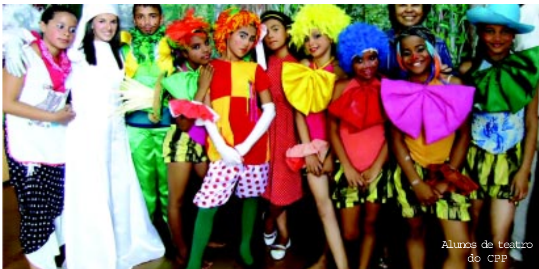
Alunos de teatro do CPP

Enília, tia Anastácia, Narcizinho junto com o Visconde de Sabugosa, tentam ajudá-lo.