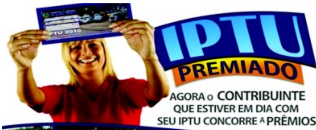
Contribuintes devem retirar cupons na prefeitura para concorrer ao sorteio

O contribuinte que possuir débito parcelado referente a estes tributos poderá participar do sor-