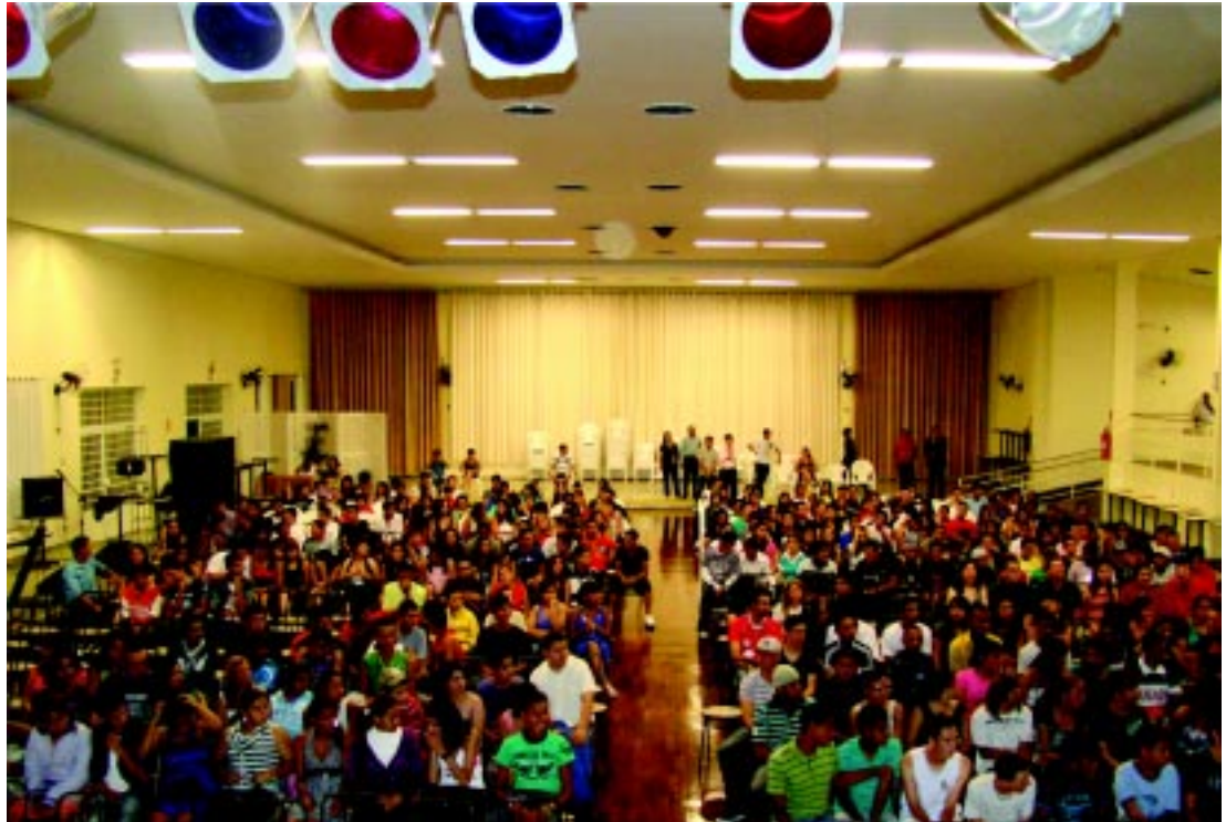
Formatura foi realizada no Salão de Eventos do Parque das Águas

Quarenta e sete jovens se formaram e agora começa uma nova etapa do programa", destacou o Secretária de Assistência Social.