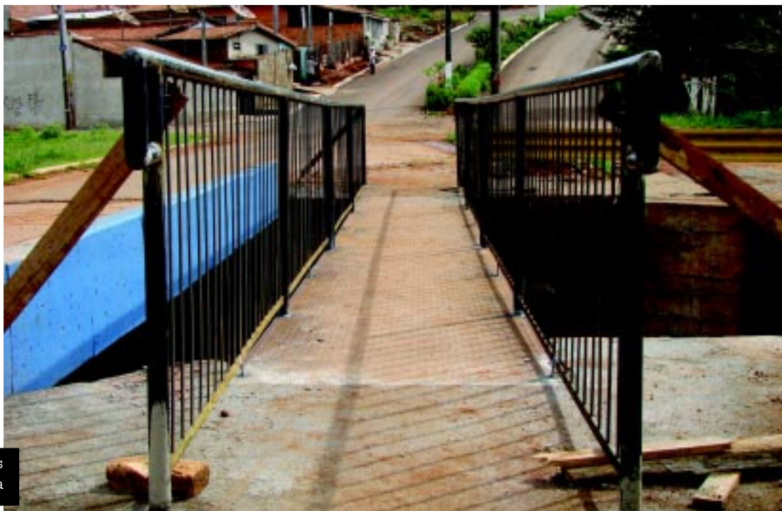
Passarela metálica montada entre as pontes que dão acesso ao Jardim Europa

Com a transferência da estrutura da ponte, a cidade economizou um investimento de mais de R$ 300 mil e resolveu de forma definitiva um problema que gerava muitas reclamações.