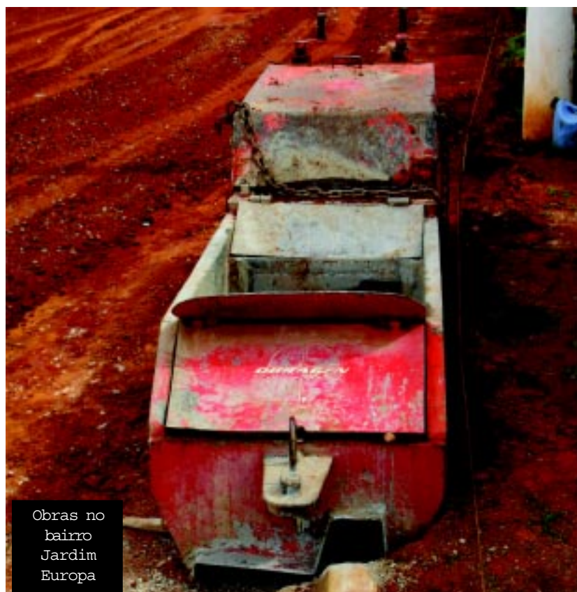
Obras no bairro Jardim Europa

A avenida José Eloes Mota, na Vila Nova Capão Bonito, também está no novo lote que prevê investimentos de quase R$ 1,4 milhão. As obras estão sendo executadas pela empresa Coragen Engenharia e Construções Ltda.