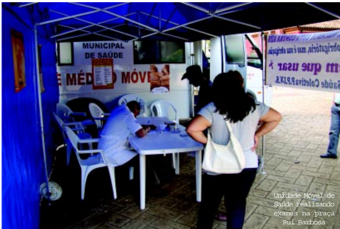
Unidade Móvel de Saúde realizando exames na praça Rui Barbosa

- O vírus HIV pode ser transmitido pelo sangue, sêmen, secreção vaginal, leite materno;