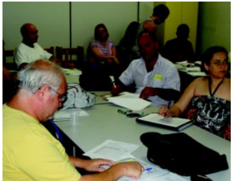
Novo pregão realizado na última segunda-feira, 29: economia de mais de R$ 18 mil em utensílios de cozinha para utilização nas Unidades Escolares

"O que prevalece sempre é o interesse público. O governo municipal quer comprar com economia e qualidade", justificou o governo municipal.