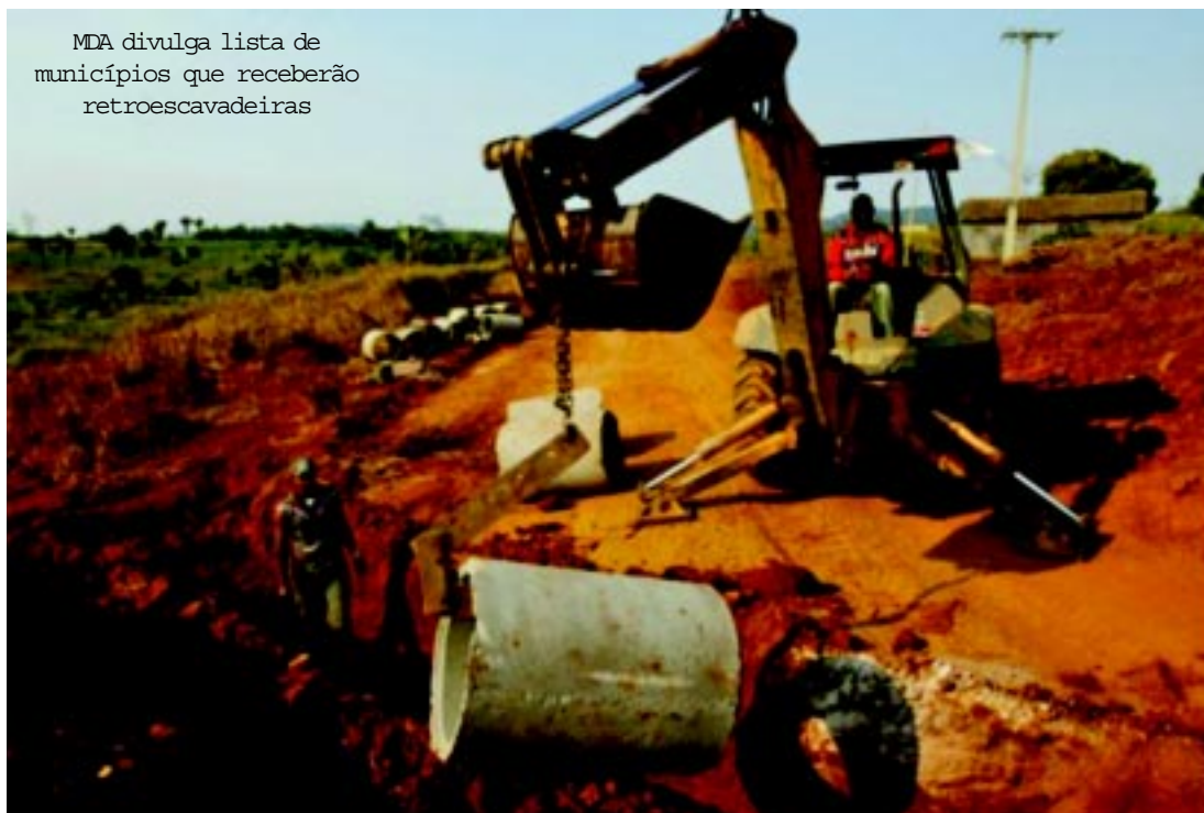
MDA divulga lista de municípios que receberão retroscavadeiras

Nesta etapa serão destinados R$ 270 milhões para a entrega de 1.274 retroscavadeiras e 13 motoniveladoras aos municípios selecionados. Outros R$ 630 milhões do Orçamento Geral da