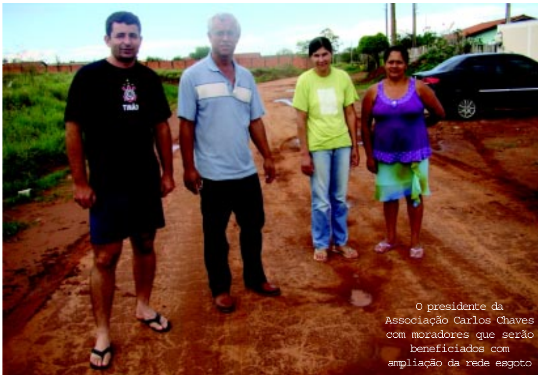
O presidente da Associação Carlos Chaves com moradores que serão beneficiados com ampliação da rede esgoto

"A rede de esgoto trará mais saúde e ampliará o saneamento no nosso bairro que vem crescendo muito e que ganha novas perspectivas com obras como esta. É o primeiro e importante passo para o asfaltamento, pois não havia como se pensar no projeto sem levar esgoto e água a essas ruas. Os moradores estão muito satisfeitos