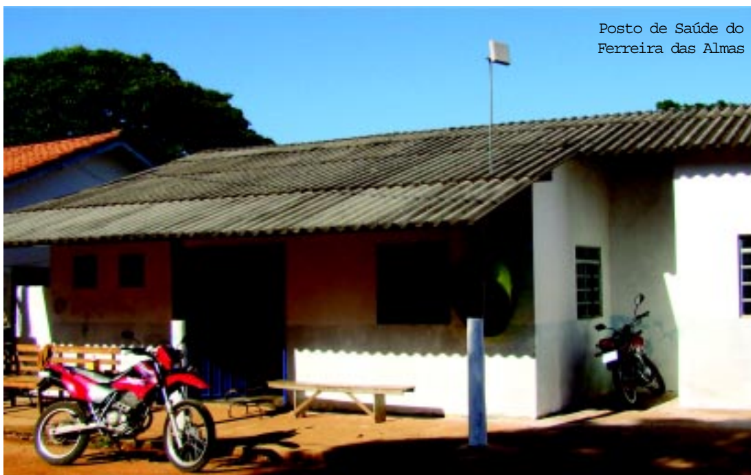
Posto de Saúde do Ferreira das Almas

Segundo a Vigilância Epidemiológica, a reestruturação do setor está possibilitando que campanhas importantes como esta cheguem a zona rural.