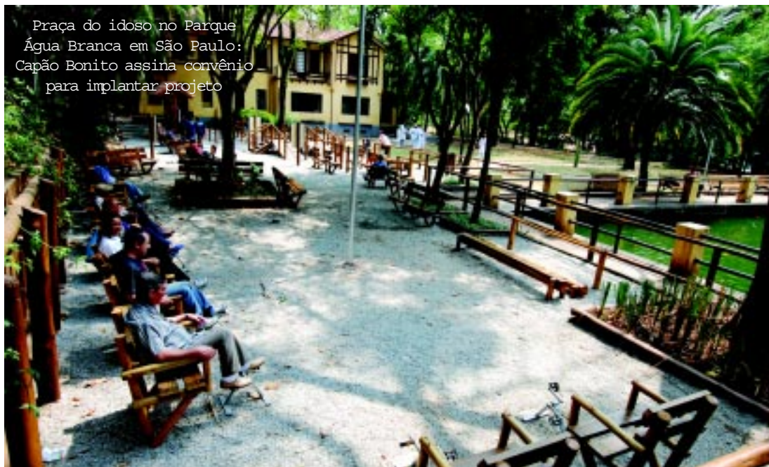
Praça do idoso no Parque Água Branca em São Paulo: Capão Bonito assina convênio para implantar projeto

O usuário tem à sua disposição seis estações de reabilitação, sendo que cada uma contempla uma