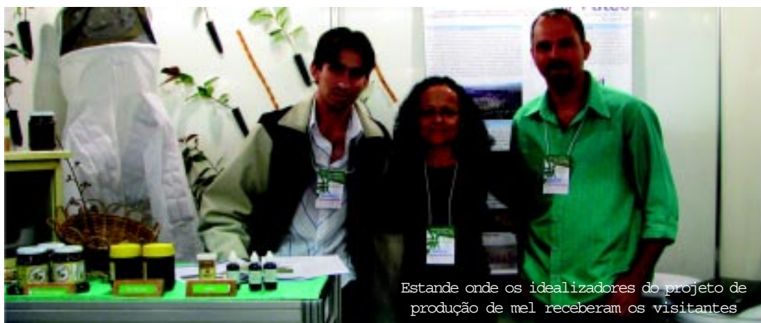
Estande onde os idealizadores do projeto de produção de mel receberam os visitantes