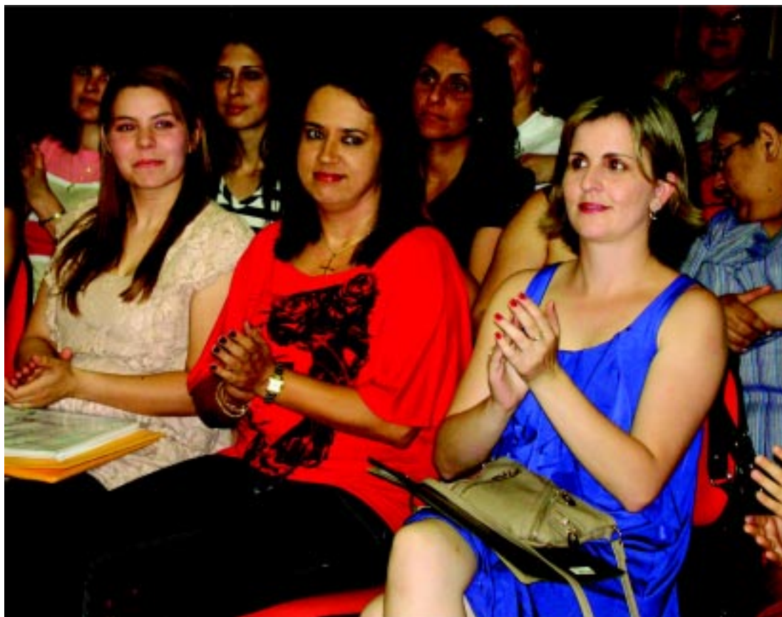
Orientadoras tiveram trabalho muito elogiado no Proinfo

Amigos, obrigada pela chance. Cresci muito com vocês.