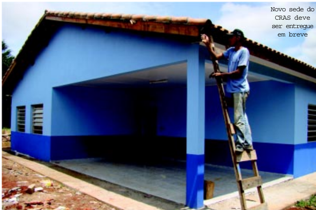
Novo sede do CRAS deve ser entregue em breve

No começo de 2009 foi realizado um relatório