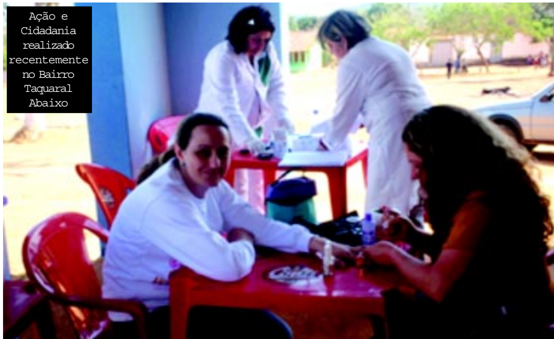
Ação e Cidadania realizado recentemente no Bairro Taquaral Abaixo

"Estamos trabalhando no sentido de ampliar cada vez mais o Ação e Cidadania, esperamos que todos os moradores da região dos Tomés participem e cuidando da saúde para que tenhamos uma população mais saudável e feliz", destacou o Fundo Social.