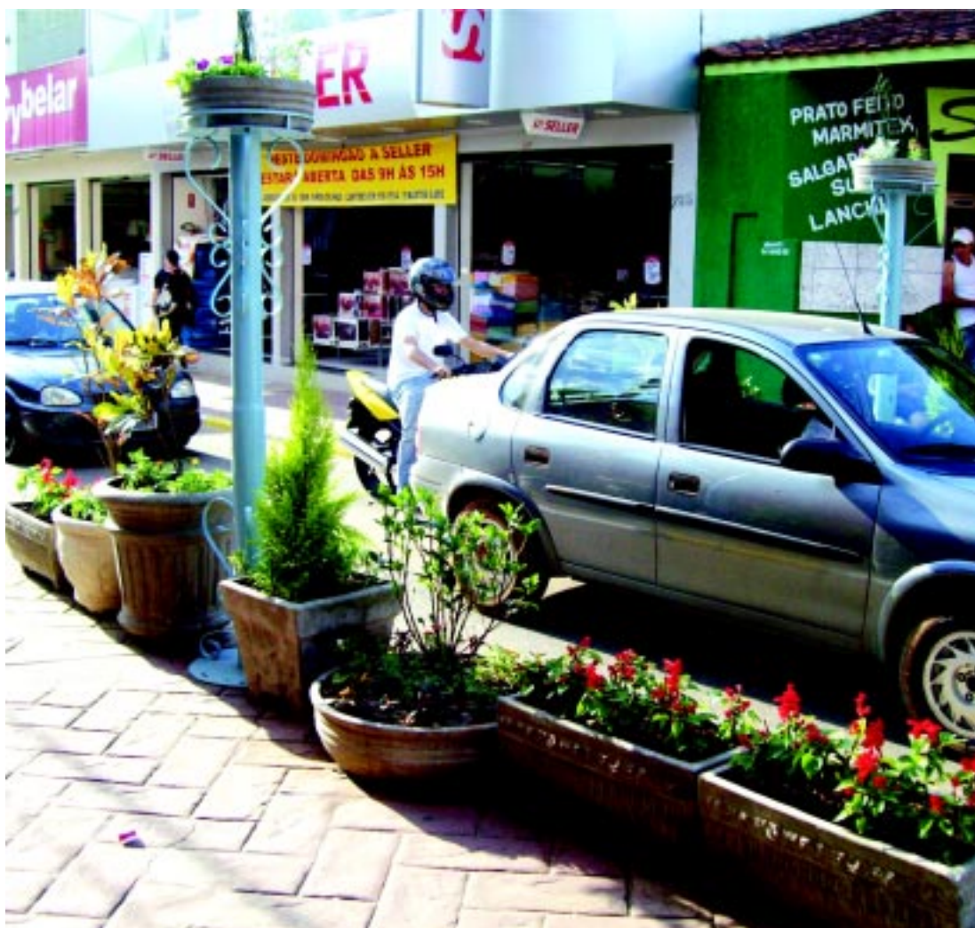
Vasos e suporte com flores na rua Floriano Peixoto

Segundo a administração, com o projeto, além de tornar a cidade mais colorida, com mais flores, também se pretende solucionar problemas como o de escoamento de águas pluviais na rua Floriano Peixoto, que chega a ficar alagada durante períodos de chuva.