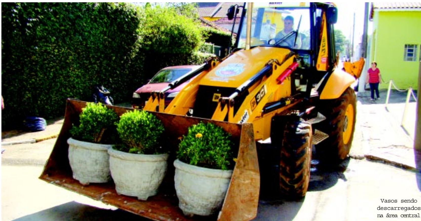
Vasos sendo descarregados na área central

PROJETO PAISAGISMO - Depois de apresentar no dia 19 de outubro, a comerciantes de Capão Bonito o projeto de paisagismo principalmente para a área central da cidade, a prefeitura de Capão Bonito já adiantou o cronograma de execução com a colocação de vasos com flores na rua Floriano Peixoto e Calçaço.