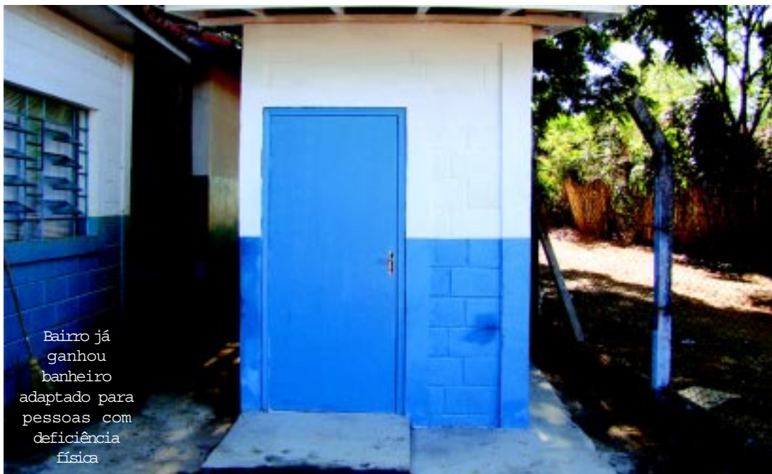
Bairro já ganhou banheiro adaptado para pessoas com deficiência física