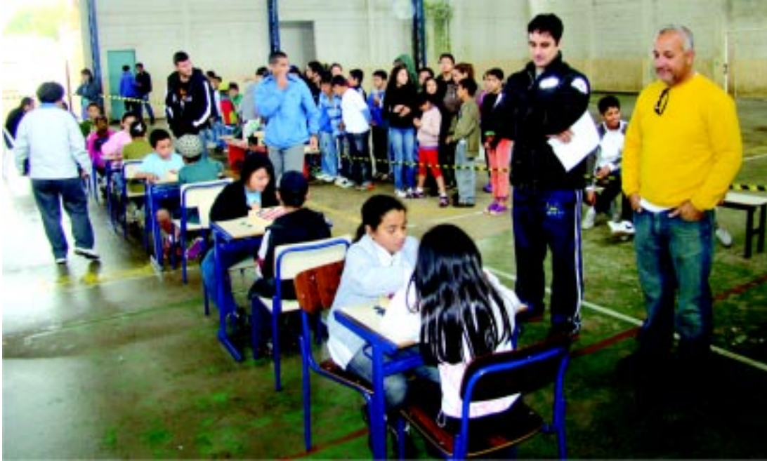
Disputada das modalidades de xadrez e dama na escola Jacyra

Segundo os organizadores cerca de 170 alunos competiram na 1ª fase dos jogos de tabuleiro