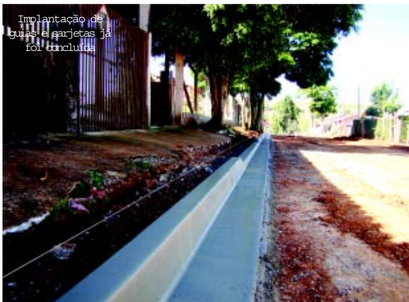
Implantação de guias e sarjetas já foi concluída

"A pavimentação traz mais infraestrutura e valoriza os imóveis. A tendência é que o bairro cresça mais partir de agora. Não teremos mais problemas com a lama durante a chuva e a poeira durante os períodos de estiagem", destacaram moradores no Jardim Alvorada.