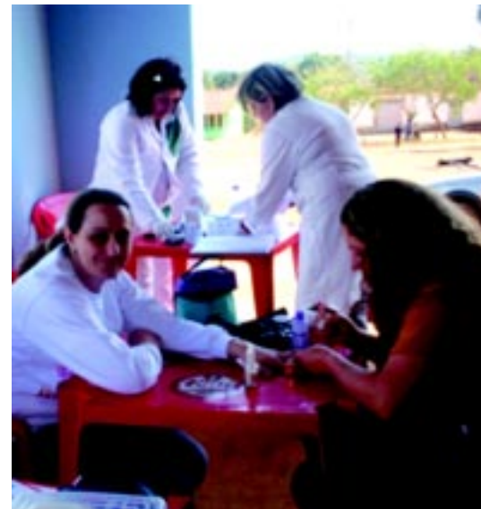
Ação e Cidadania realizado recentemente no Bairro Taquaral Abaixo

"Estamos trabalhando no sentido de ampliar cada vez mais o Ação e Cidadania, esperamos que todos os moradores da região dos Tomés participem e cuidando da saúde para que tenhamos uma população mais saudável e feliz", destacou o Fundo Social.