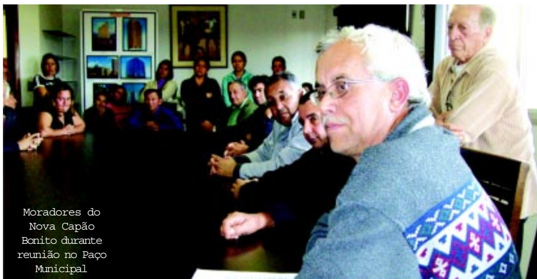
Moradores do Nova Capão Bonito durante reunião no Paço Municipal