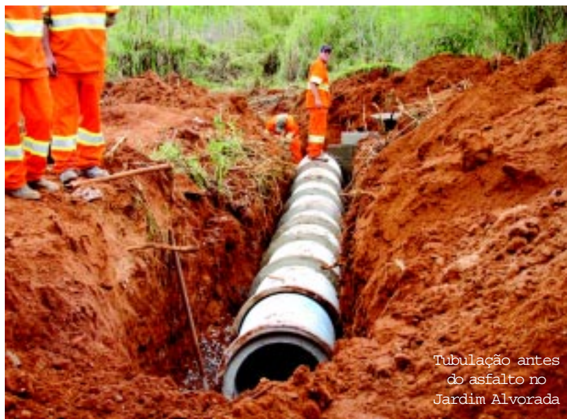
Tubulação antes do asfalto no Jardim Alvorada