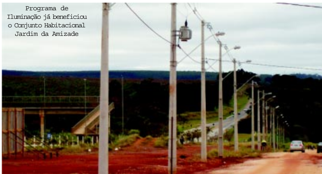
Programa de Iluminação já beneficiou o Conjunto Habitacional Jardim da Amizade

Moradores e futuros moradores do Conjunto Habitacional Capão Bonito E2 – o popular Jardim da Amizade – também já foram beneficiados pelo programa.