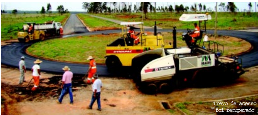
Trevo de acesso foi recuperado