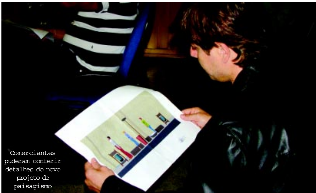
Comerciantes puderam conferir detalhes do novo projeto de paisagismo

o de escoamento de águas pluviais na rua Floriano Reixoto, que chega a ficar alagada durante períodos de chuva.