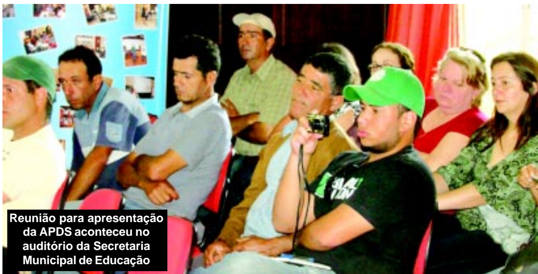
Reunião para apresentação da APDS aconteceu no auditório da Secretaria Municipal de Educação