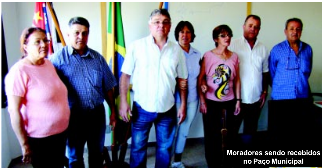
Moradores sendo recebidos no Paço Municipal

COMUNIDADES RURAIS – Representantes da Associação de Moradores do Bairro Querência do Turvo, localizado às margens da rodovia Francisco da Silva Ponte (SP-127) na zona rural da cidade, foram recebidos no Paço Municipal no começo desta semana.