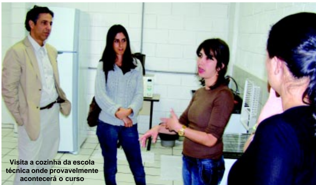
Visita a cozinha da escola técnica onde provavelmente acontecerá o curso

“Contudo, ao capacitarmos uma rede de multiplicadores, por meio de oficinas de educação alimentar e nutricional, com abordagem participativa e construtivista, desenvolveremos em cada município da região, uma ampla divulgação e abordagem acerca dos conceitos fundamentais e práticos para a promoção da segurança alimentar. É evidente que o objetivo deste projeto será concretizado em fazer chegar todo conhecimento e técnicas absorvidas em cada oficina à população em geral, que sofre com a insegurança alimentar. Para isto, visando a sustentabilidade e resultados concretos das ações, as atividades serão desenvolvidas em 4 (quatro) Pólos de Segurança Alimentar, alocados fisicamente nos Municípios de Apiaí, Capão Bonito, Itapeva e Itararé, de onde surgirá o processo de replicação de conhecimento”, informaram as representantes da Fundação Orsa.