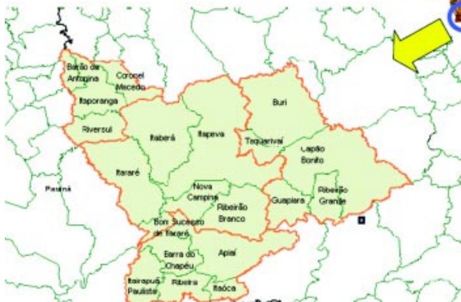
Mapa com as cidades beneficiadas pelo projeto “Capacitando para Crescer: Formação de Multiplicadores em SAN”

A percepção de segurança alimentar medida pelo Instituto Brasileiro de Geografia e Estatística – IBGE, na Pesquisa Nacional por Amostra de Domicílio - PNAD (2004), indicou que no estado de São Paulo, onde se concentra a maior produção de riquezas do país, cerca de 30,5% da população residente em domicílios particulares sofre com algum grau de insegurança alimentar.