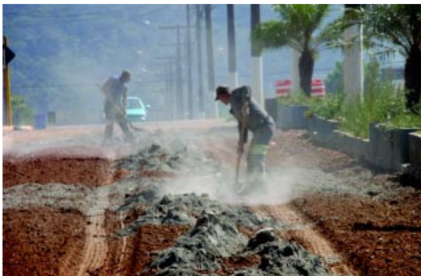
Cimento sendo misturado ao solo para preparação da base da pavimentação

Após a compactação será executada a proteção e cura da base. É lago para evitar infiltrações e problemas. Uma obra bem executada”, explicou a Secretaria de Obras.