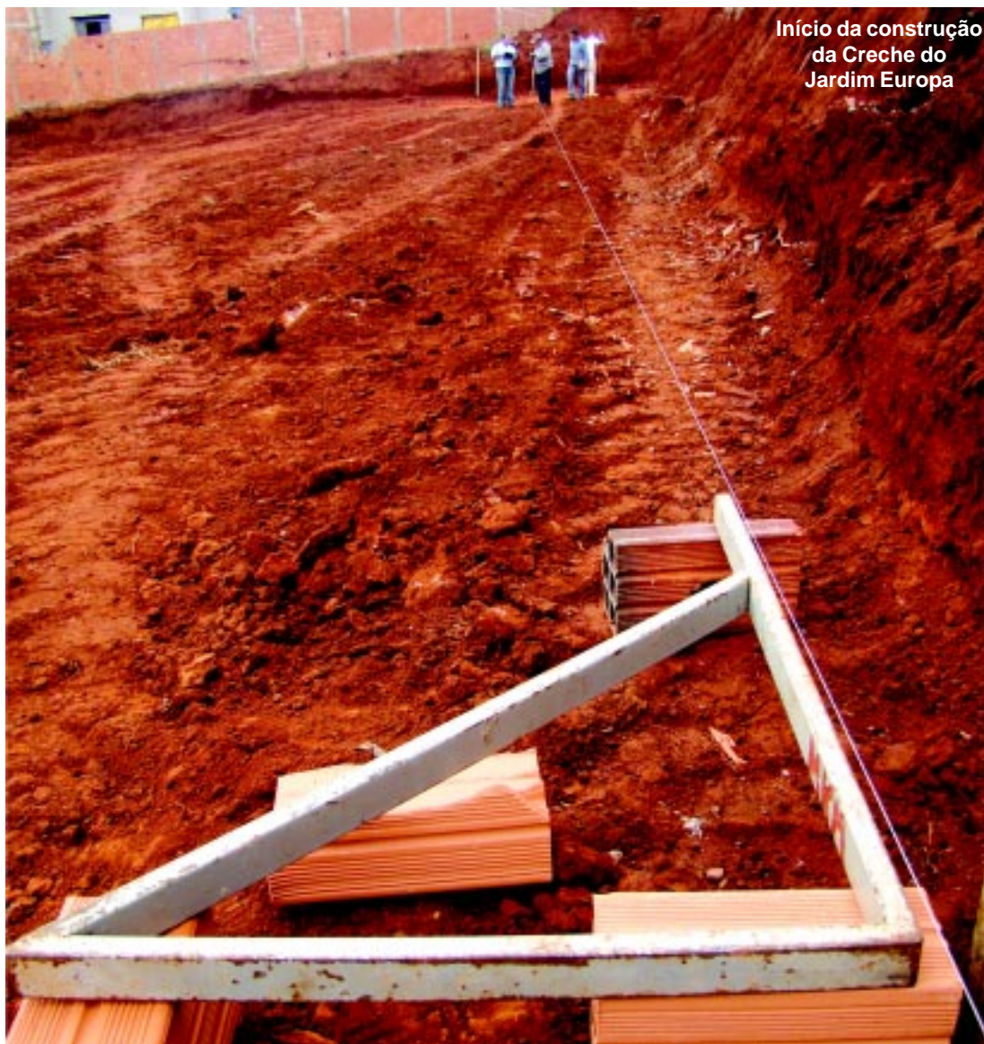
Início da construção da Creche do Jardim Europa

Conforme o acordo, após a colocação de tubulação e construção de galerias, os trechos com problemas serão recuperados.