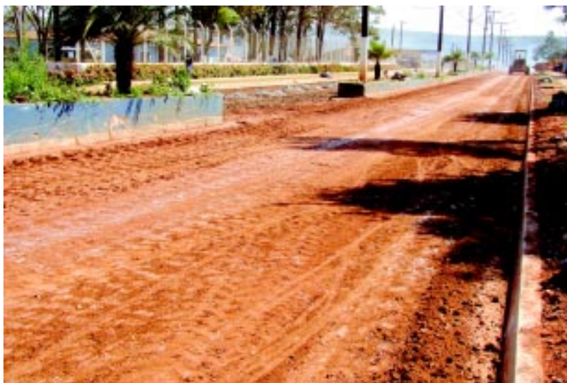
Trecho já compactado