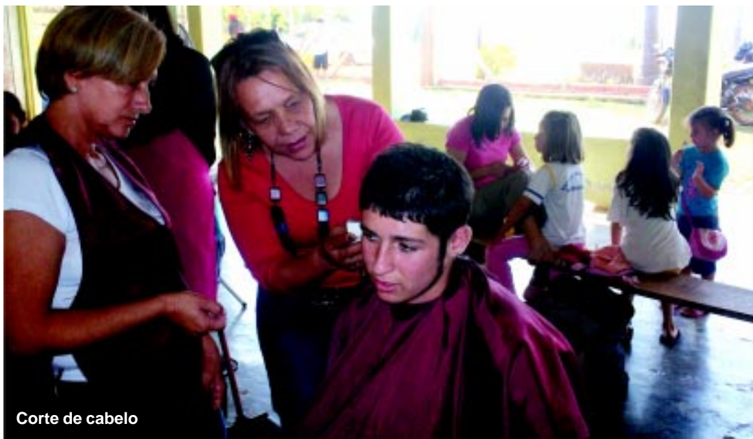
Corte de cabelo