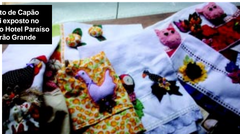
Artesanato de Capão Bonito foi exposto no exposição no Hotel Paraíso de Ribeirão Grande