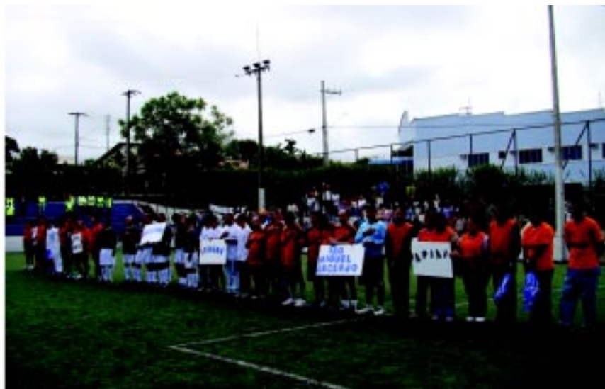
Edição 2009 do Intercaps teve mais de 200 participantes