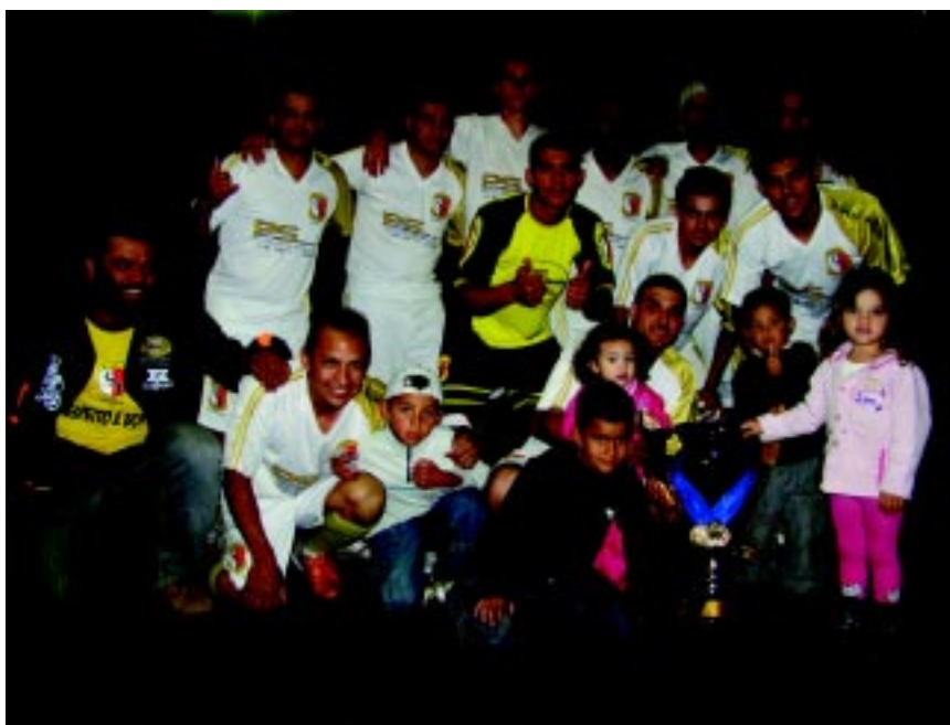
A equipe do Comercial São Judas/Serralheria Dingo grande campeã