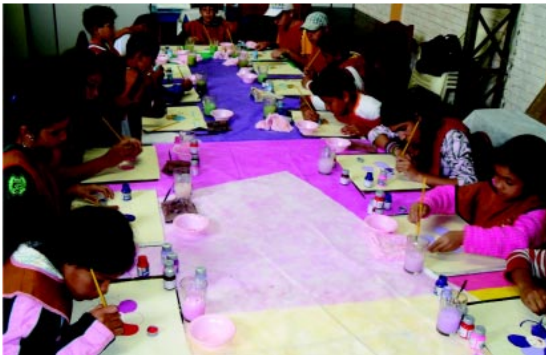
Curso de pintura

Assistir a um bom espetáculo teatral é uma atividade de lazer, cultura e prazer, um passatempo lúdico, numa participação verdadeira.