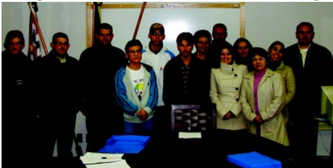
Os novos conselheiros de saúde