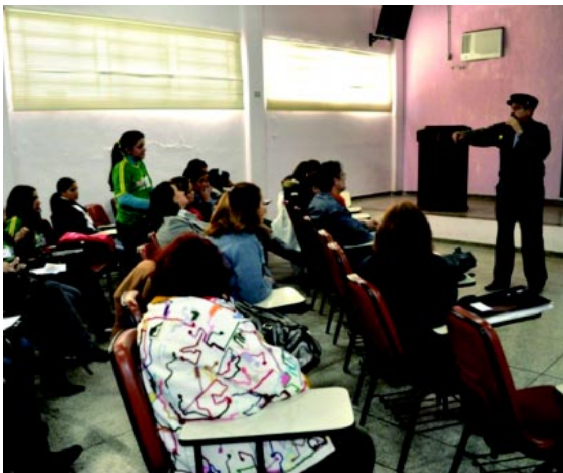
I Encontro Lúdico Regional

O presidente do CONDECA agradeceu a Comissão Regional DCA e o CMDCA de Itapeva pelo evento, a presença dos componentes da mesa de trabalhos e as crianças e adolescentes pela participação e pelas propostas bem definidas e de iniciativas próprias, dando por encerrado o I Encontro Lúdico Regional dos Direitos da Criança e do Adolescente.