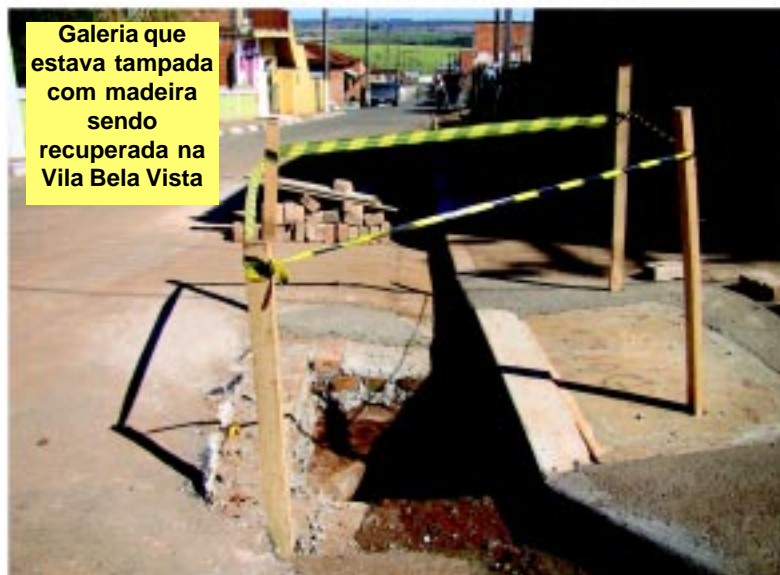
Galeria que estava tampada com madeira sendo recuperada na Vila Bela Vista