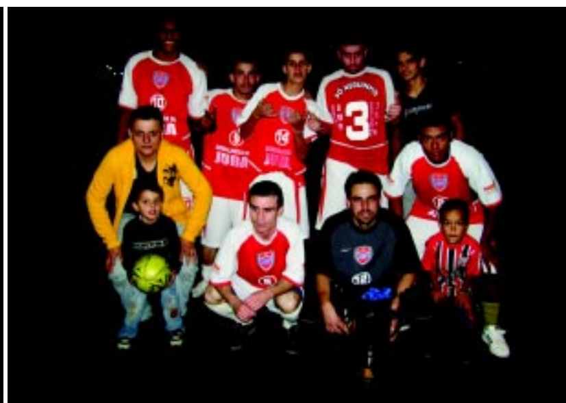
Os Pagodeiros ficaram com o terceiro lugar