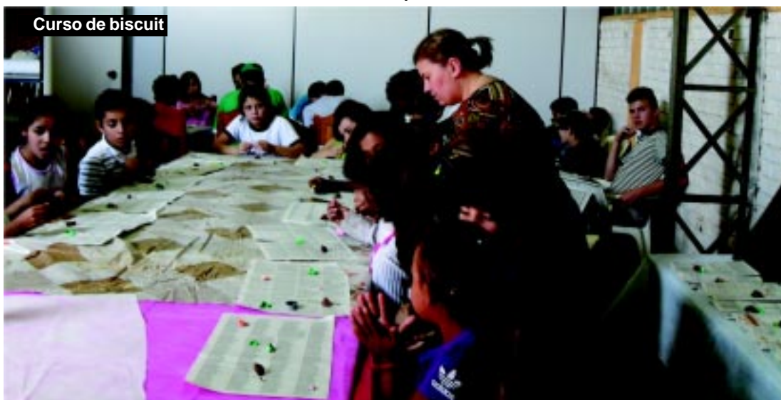
Curso de biscuit