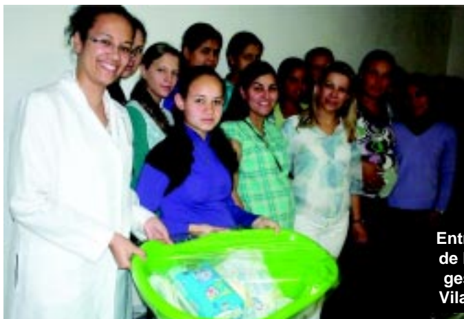
Entrega de kits de bebês para gestantes na Vila São Paulo

O objetivo foi valorizar o artesanato da comunidade e gerar renda os artesãos do município.