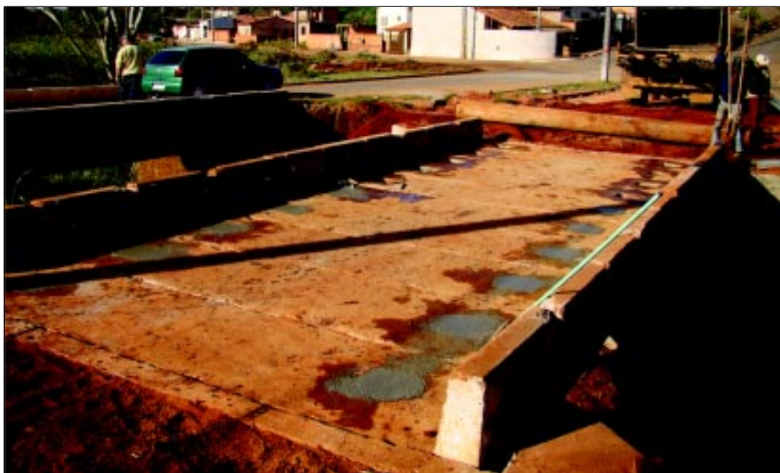
Ponte montada: transferência concluída na última quinta-feira