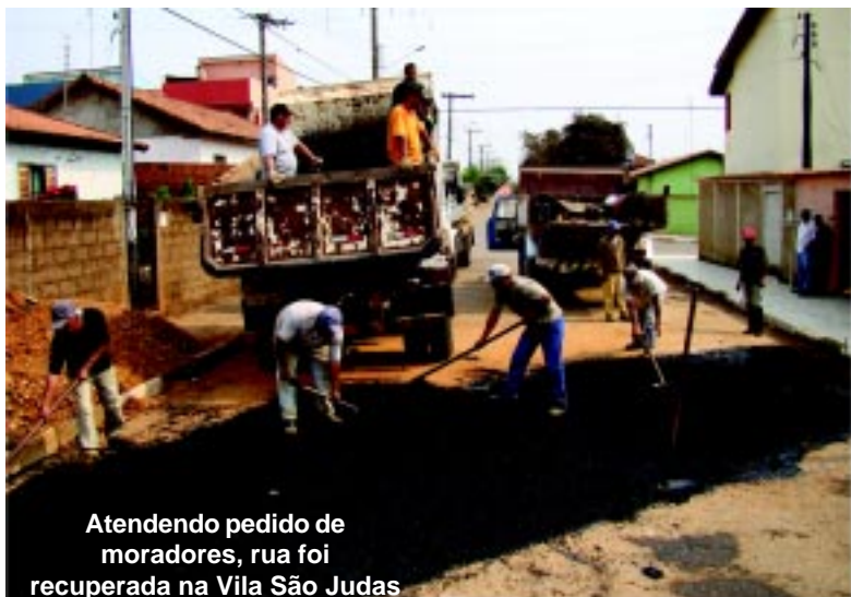
Atendendo pedido de moradores, rua foi recuperada na Vila São Judas