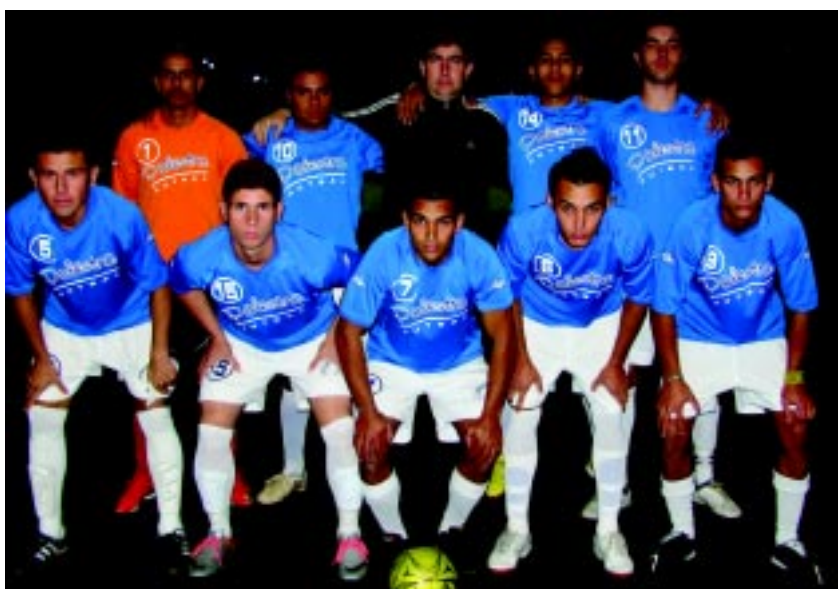
O elenco vice-campeão do Center Vidros