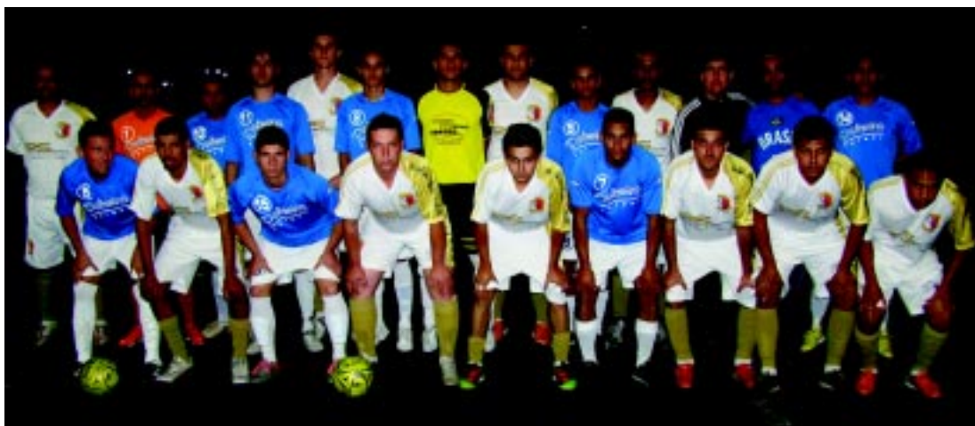
Jogadores das duas equipes que disputaram a final

Na final entraram em campo para decidir o título as equipes do Comercial São Judas/Serra-