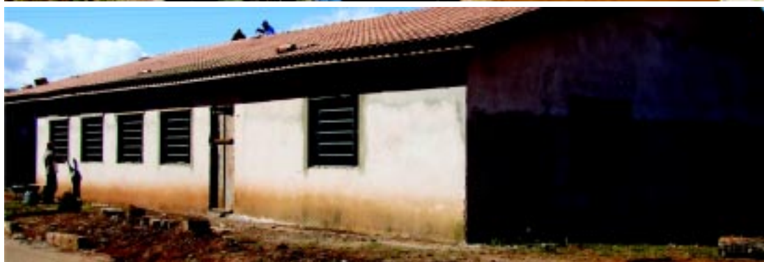
Obras em andamento na nova sede do CRAS na Vila São Paulo: prazo para conclusão é de quatro meses