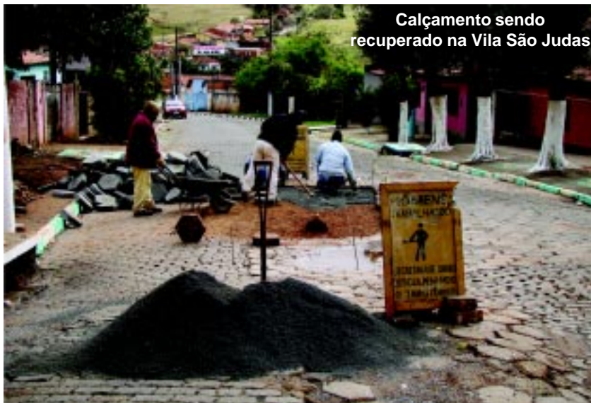
Calçamento sendo recuperado na Vila São Judas