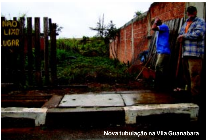
Nova tubulação na Vila Guanabara

“Para acelerar os serviços foram criadas várias equipes de trabalho. O objetivo é atender de uma forma mais rápida os moradores”, destacou o governo municipal.