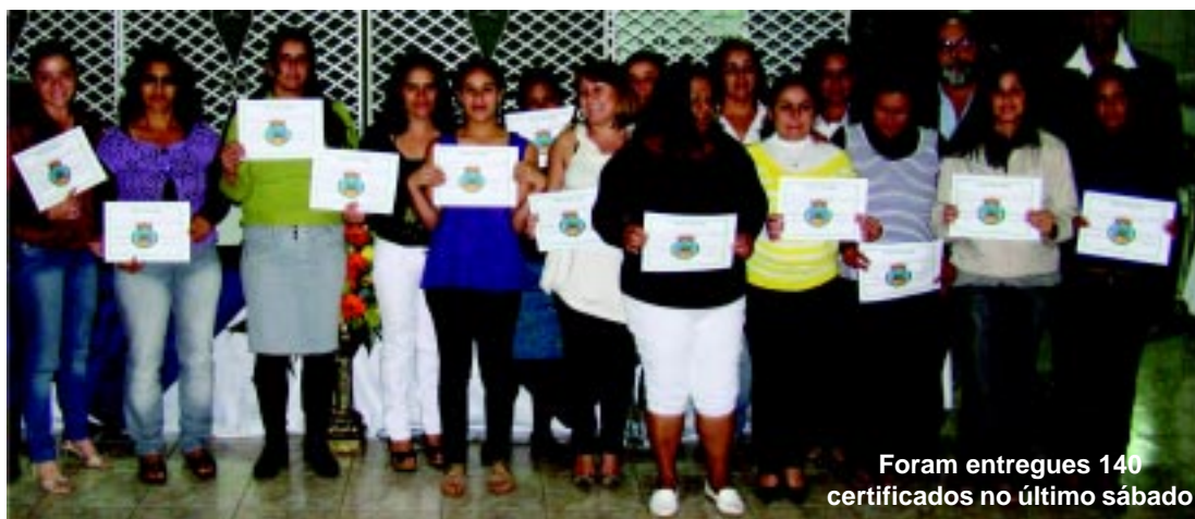
Foram entregues 140 certificados no último sábado

“As pessoas querem cada vez mais ter oportunidades de produzir, melhorando de vida e não só ficar dependendo de programas estaduais e federais”, destacou a secretária. “Desde o início de 2009 implementamos várias ações. Investimos mais em saúde, Educação e Infraestrutura. A geração de emprego e renda também faz parte do nosso plano de governo. Não há programa social que substitua o emprego e por isso estamos investindo em curso de qualificação, além de incentivarmos os microempreendedores através do Banco do Povo”, acrescentou o governo municipal.