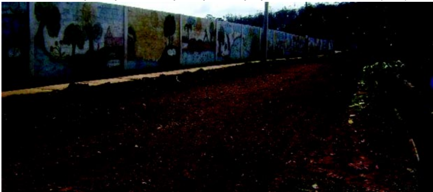
Rua Pedro Gonçalves de Almeida sendo preparada para asfaltamento

Os serviços de terraplenagem e construção de guias e sarjetas no novo lote de pavimentação, no Jardim Alvorada, também já começaram.