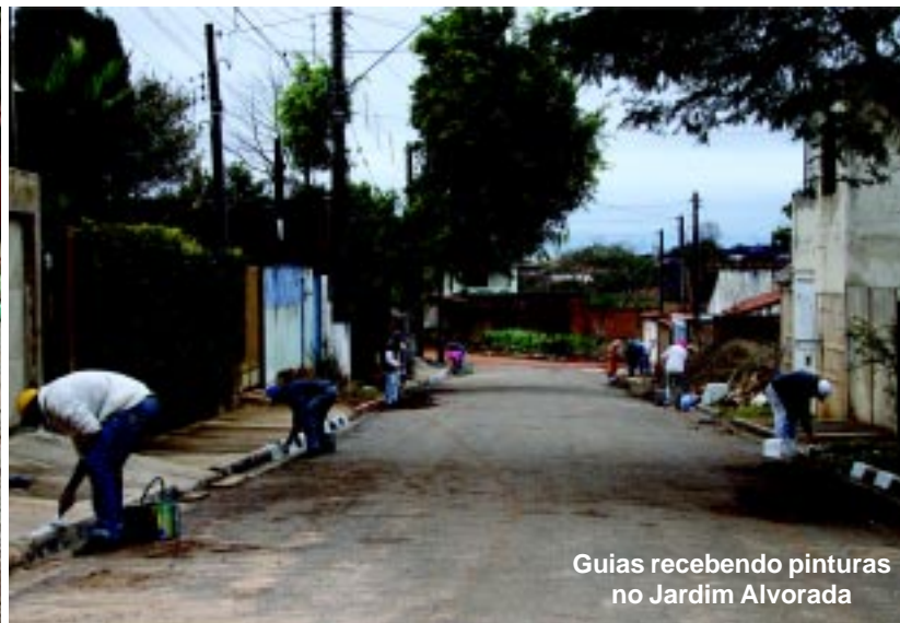
Guias recebendo pinturas no Jardim Alvorada