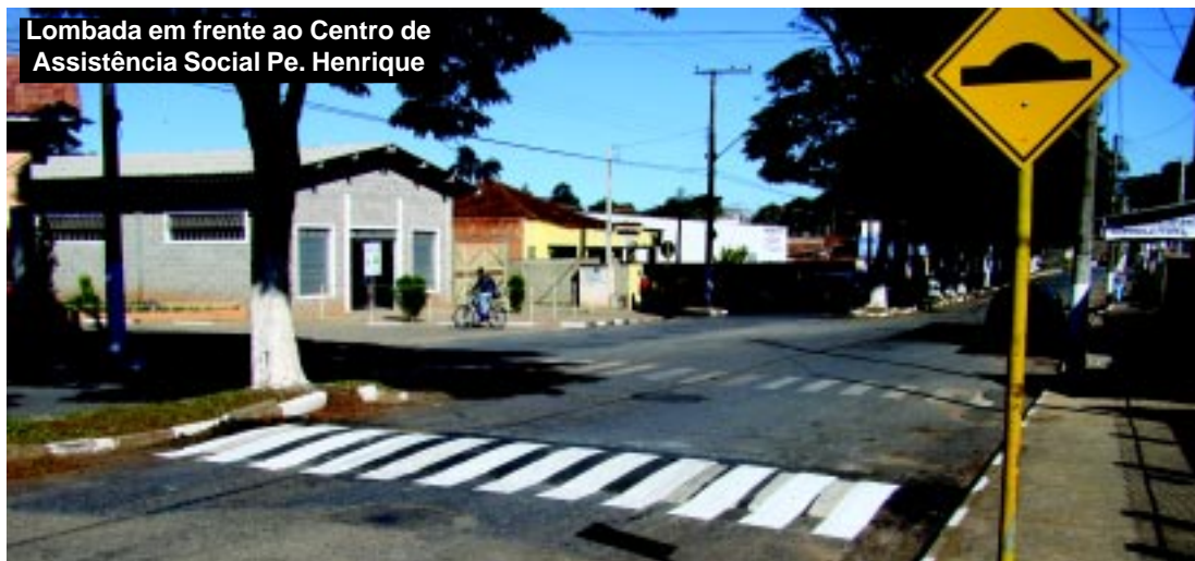
Lombada em frente ao Centro de Assistência Social Pe. Henrique

executa outras ações para melhorar a segurança no trânsito como a pinturas de faixas de pedestres, sinalização e manutenção dos semáforos.