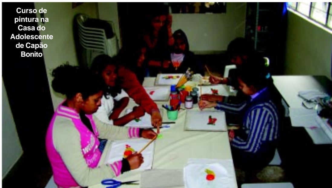
Curso de pintura na Casa do Adolescente de Capão Bonito

“A Casa do Adolescente é um espaço de referência integral ao adolescente através de apoio sócio-educativo em meio aberto e de atendimento bio-psico-social em caráter preventivo e curativo. Queremos modificar o olhar que a sociedade tem dos jovens, essa também é uma das nossas metas. A proposta também é permitir aos adolescentes em situação de risco e suas famílias, a possibilidade de experimentar as diferentes linguagens de expressão, criando uma corrente de cidadania para transformação de si e de