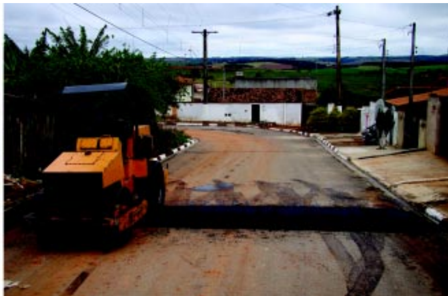
Lombadas sendo adequadas à Resolução 39 do CTB