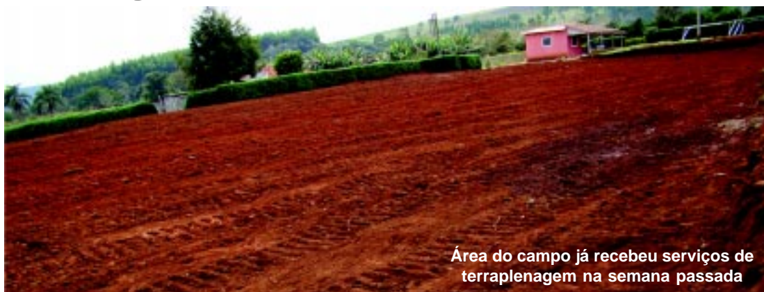
Área do campo já recebeu serviços de terraplenagem na semana passada

Segundo o governo municipal, há muitos anos os moradores reivindicavam o campo e a ação faz parte do Programa de Apoio às Comunidades Rurais, iniciado em 2009 e que já levou diversas melhorias a vários bairros.