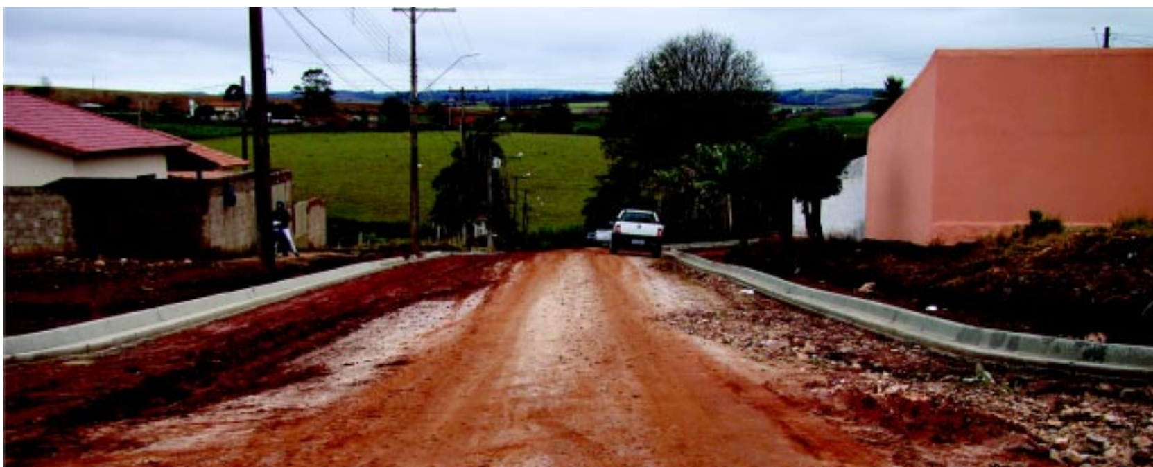
Rua já com guias no Jardim Alvorada - Novo lote de pavimentação