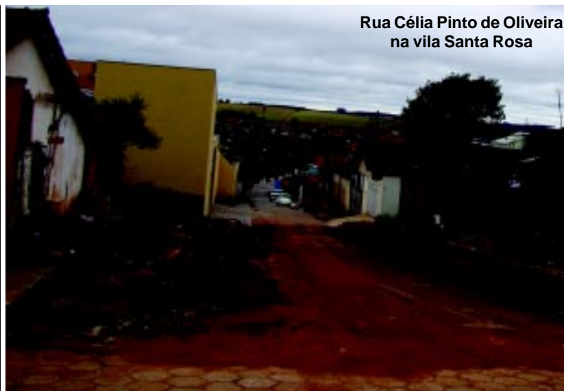
Rua Célia Pinto de Oliveira na vila Santa Rosa