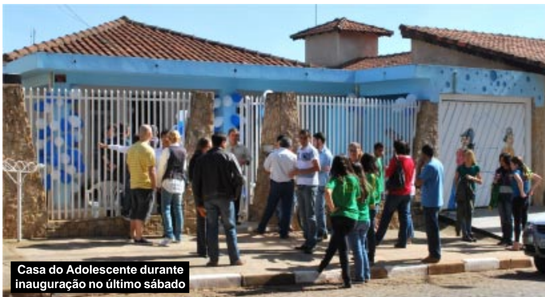
Casa do Adolescente durante inauguração no último sábado

Outra autoridade que elogiou as ações de