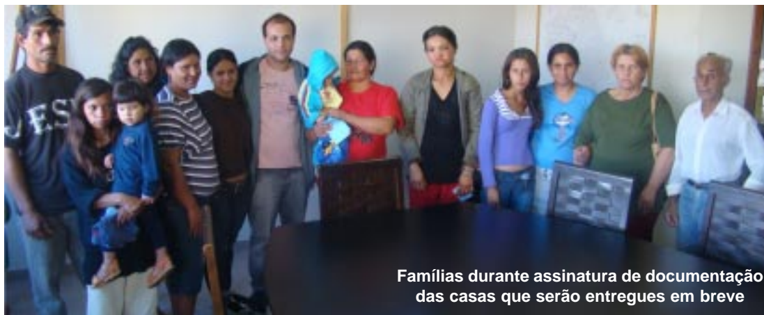
Famílias durante assinatura de documentação das casas que serão entregues em breve

“Além de concluir as casas. Também estamos preocupados com a infraestrutura e já estamos licitando o asfaltamento dos conjuntos do Boa Esperança e Jardim da Amizade”, destacou a prefeitura.