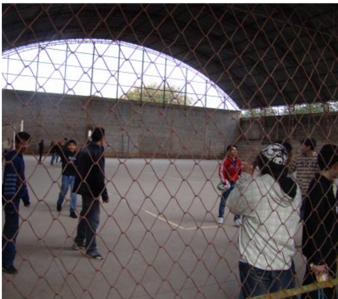
Quadra da escola Oscar Kurtz Camargo será concluída

“É mais uma obra que estava paralisada e que estaremos concluindo. A quadra se transformará num dos principais locais para prática esportiva e eventos, além de beneficiar diretamente os estudantes da escola Oscar Kurtz”, destacou o governo municipal.