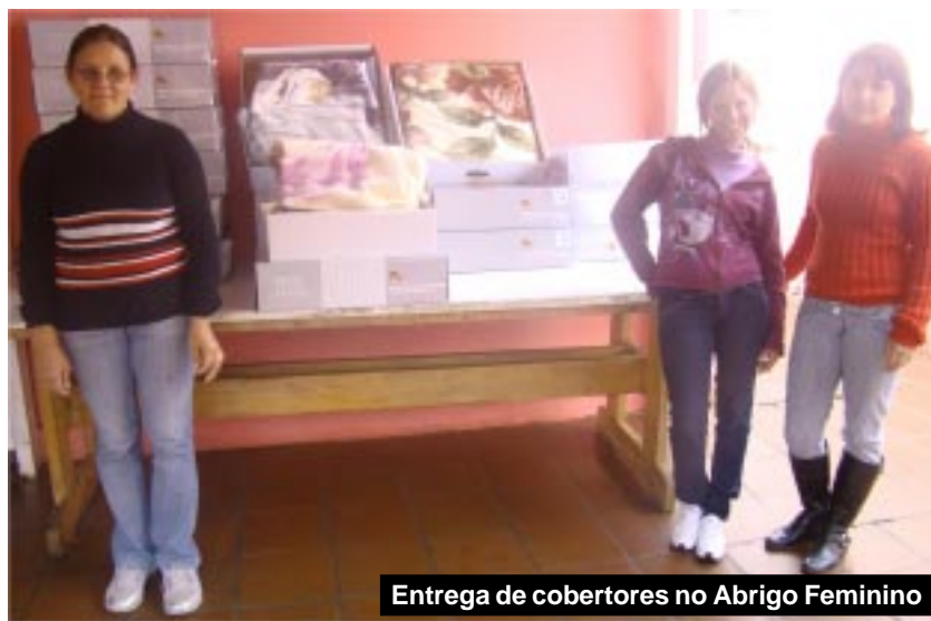
Entrega de cobertores no Abrigo Feminino