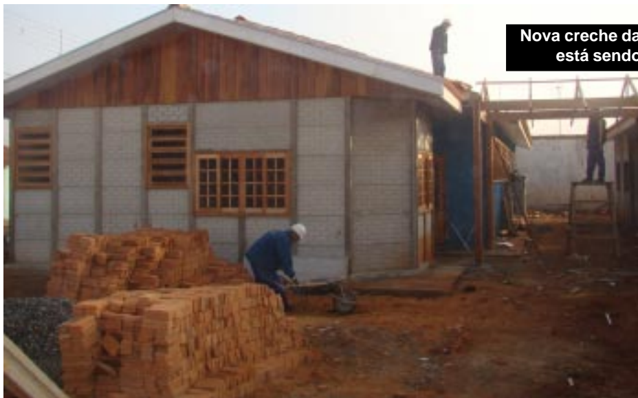
Nova creche da Vila Aparecida está sendo concluída

Ao final das obras, a Vila Aparecida terá duas creches bem estruturadas e com maior capacidade para atender os moradores.