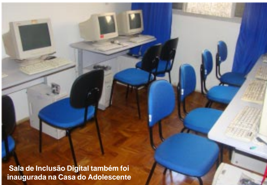
Sala de Inclusão Digital também foi inaugurada na Casa do Adolescente