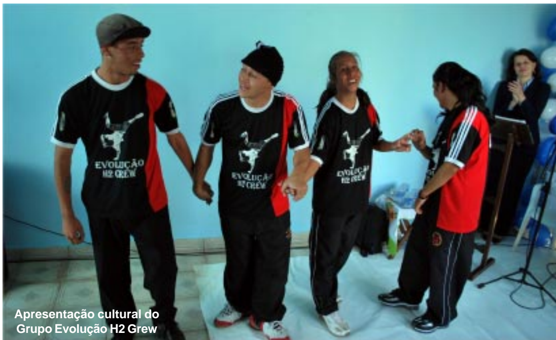
Apresentação cultural do Grupo Evolução H2 Grew

O projeto é uma iniciativa da entidade Legiãoários de Capão Bonito desenvolvido frente à situação de desemprego gerada pela proibição do trabalho de menores de 18 anos em algumas funções, que afetou diretamente a Zona Azul, o único programa que no município empregava 40 jovens de 16 a 18 anos, tido como referência e esperança do primeiro emprego. A inserção deste público de Capão Bonito contribuirá com o desenvolvimento do município gerando emprego e renda.