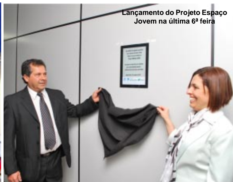
Lançamento do Projeto Espaço Jovem na última 6ª feira

CAPÃO BONITO Câmara Municipal de Capão Bonito