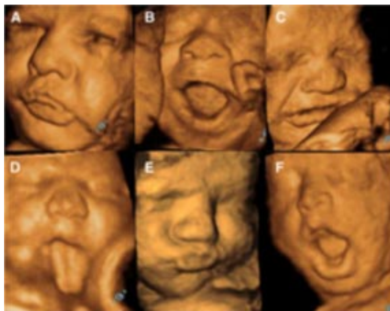
Resolução do ultrassom 4D impressionam

Já o 4D, utiliza a mais avançada tecnologia