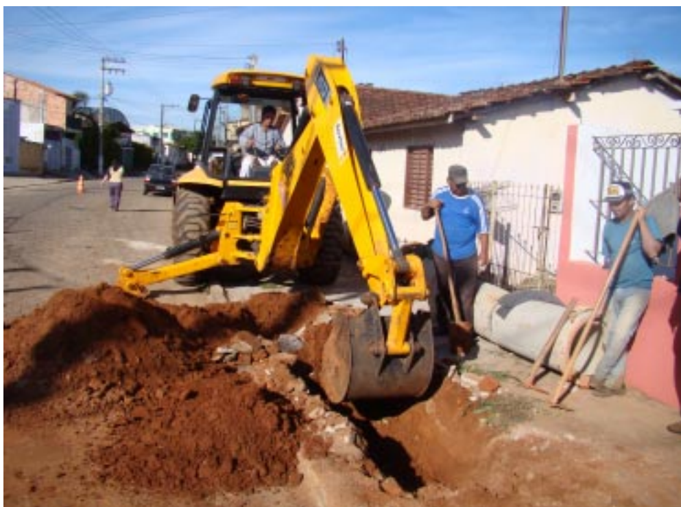
Obras na rua Cônego Luiz prevenirão inundações

OBRAS E SERVIÇOS – A Secretaria Municipal de Obras está concluindo o sistema de captação de águas pluviais na rua Cônego Luiz, na Vila Santa Rosa, em Capão Bonito.