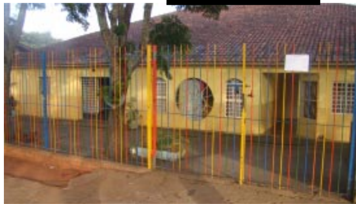
Creche Anair Bestel também será reformada