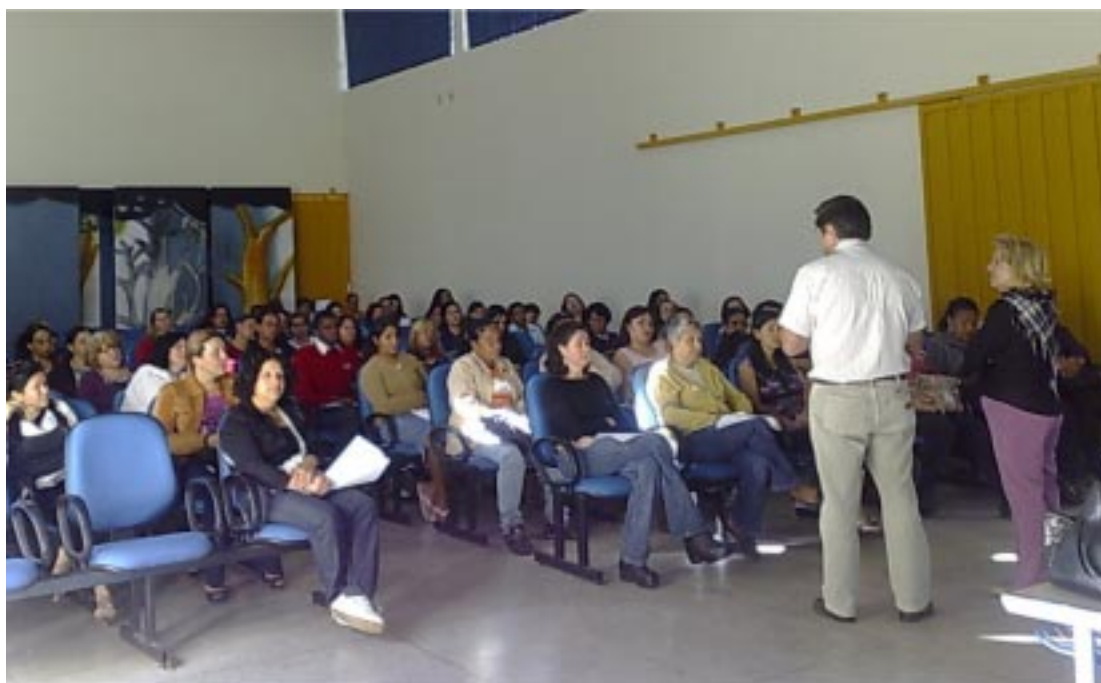
Aperfeiçoamento e treinamento promovido pelo Departamento de Merenda Escolar na escola Oscar Kurtz em 2009: escolas elogiam qualidade da merenda

O departamento já recebeu elogios de várias escolas e também da APAE recentemente.