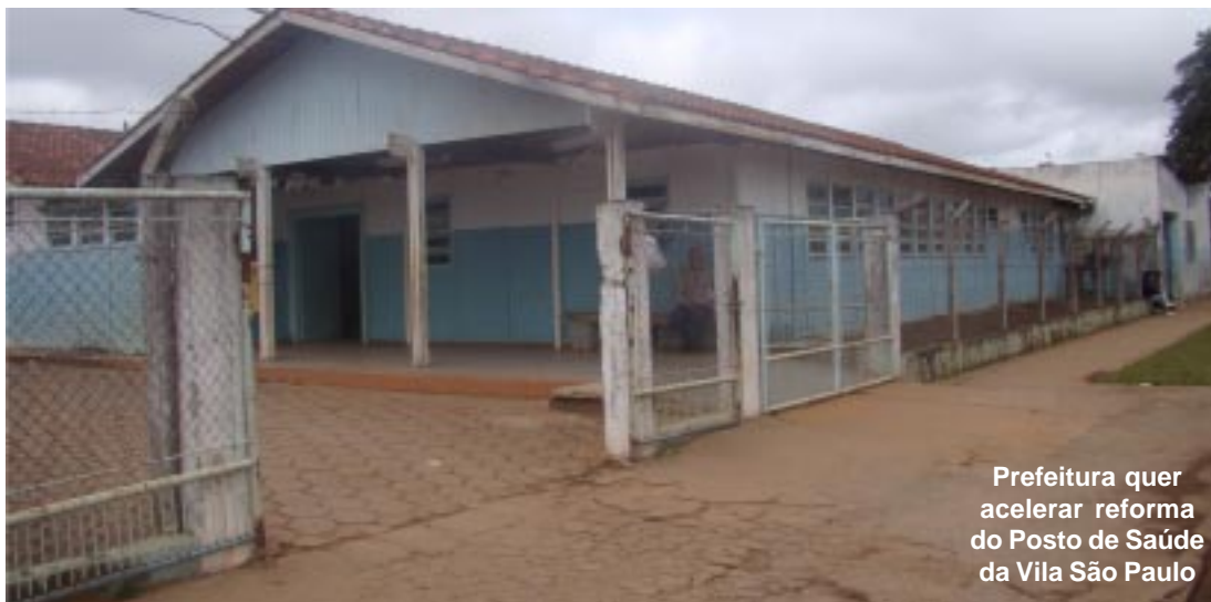
Prefeitura quer acelerar reforma do Posto de Saúde da Vila São Paulo

“A prioridade máxima do governo é tentar melhorar os níveis de saúde dos municípios paulistas. Uma das coisas que discutimos muito e aprendemos com o ex-governador Montoro, que era um ser político por excelência, é que uma dificuldade na política não é saber destinar o recurso entre o bem e o mal, é saber destinar o recurso, que é pouco, face as necessidades múltiplas, entre o bem e o bem. Vejo empenho nos representantes de Capão Bonito para melhorar os indicadores e a estrutura de atendimento do setor de saúde”, afirmou o secretário.