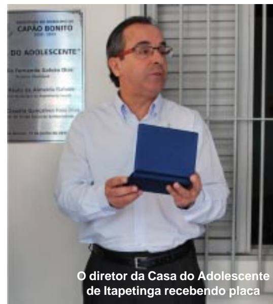
O diretor da Casa do Adolescente de Itapetinga recebendo placa