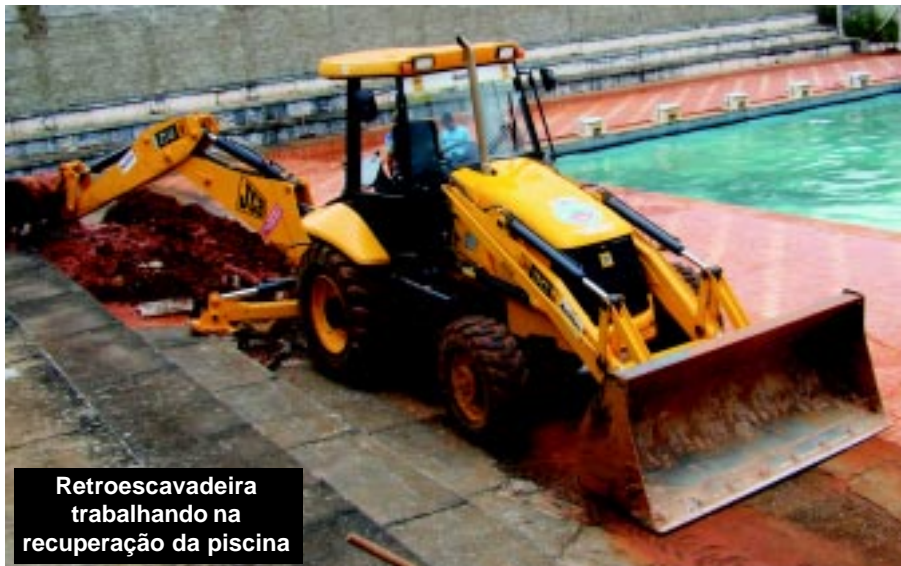
Retroescavadeira trabalhando na recuperação da piscina