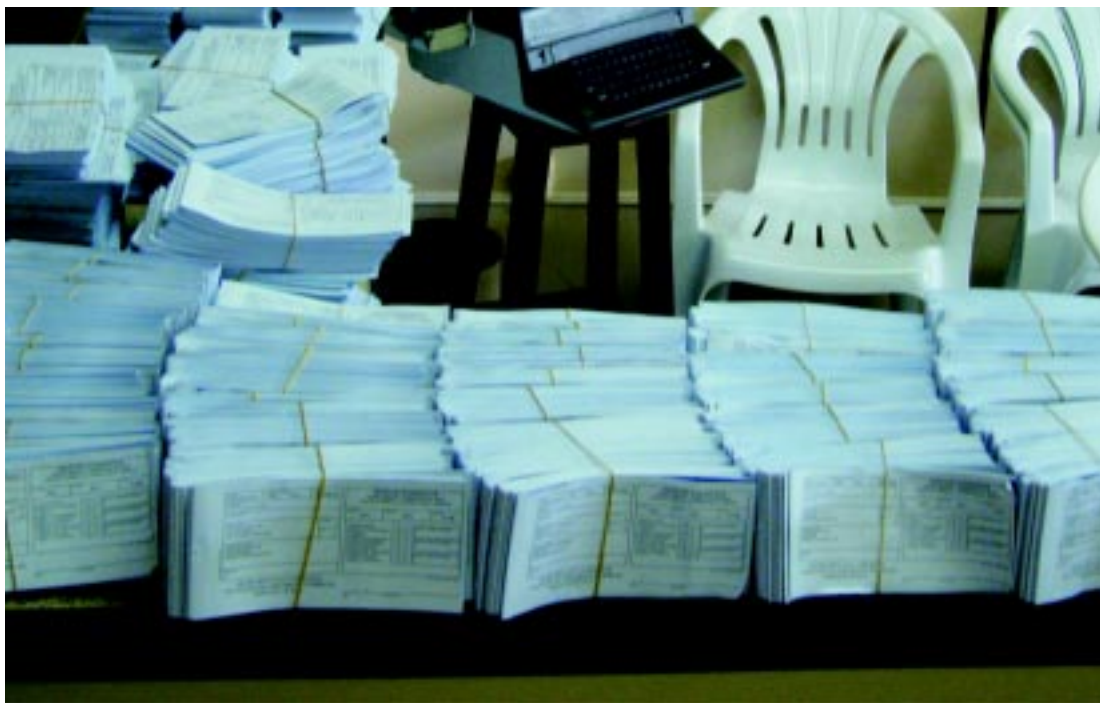
Carnês no Departamento de Tributação da prefeitura de Capão Bonito

A prefeitura também tem a expectativa de que a maioria dos contribuintes façam opção por pagar o IPTU à vista, pois será mantido o desconto.