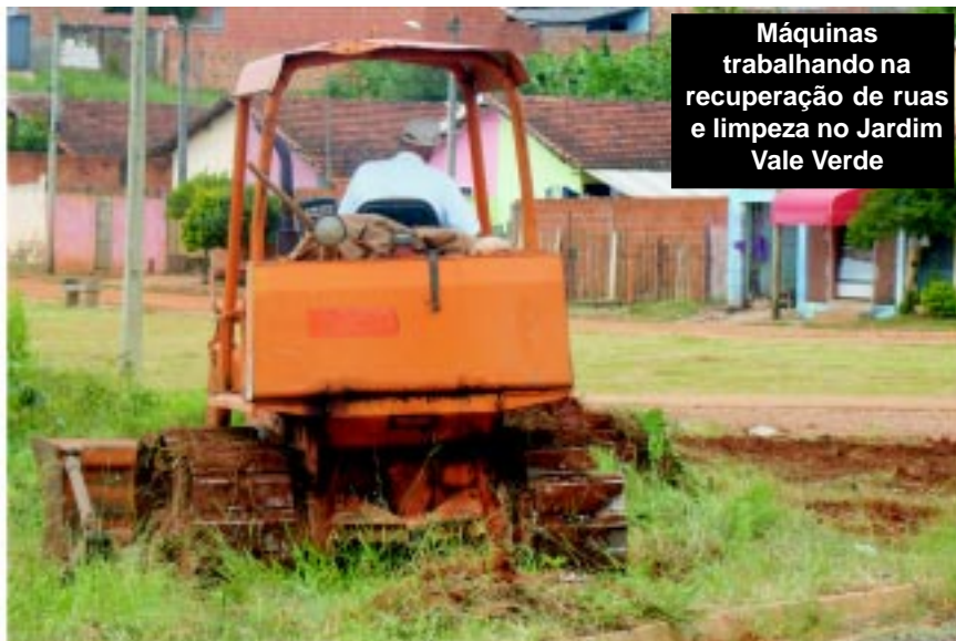
Máquinas trabalhando na recuperação de ruas e limpeza no Jardim Vale Verde