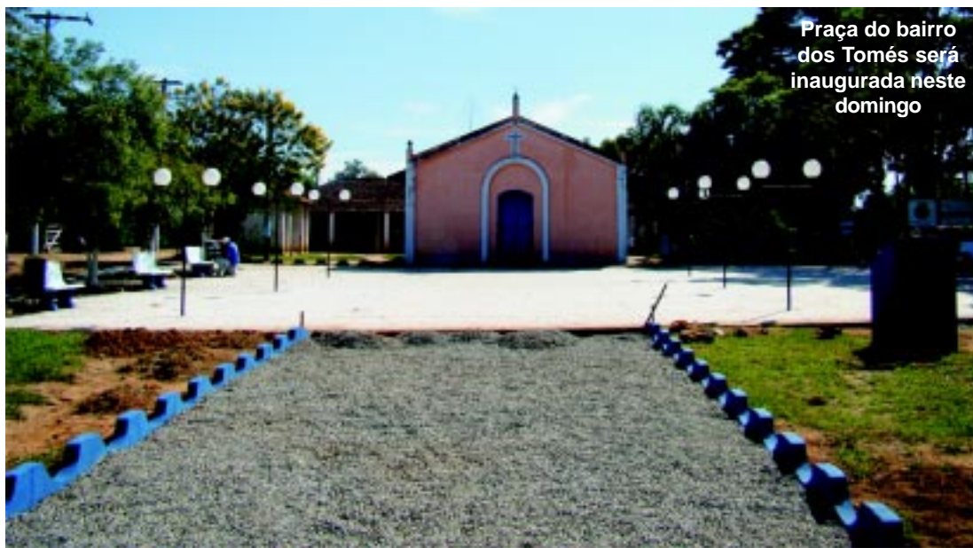
Praça do bairro dos Tomés será inaugurada neste domingo

Já foi feito contato com a Sabesp para construir um poço artesiano no bairro para que os mo-