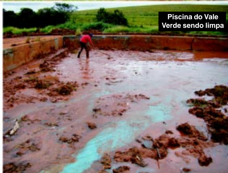
Piscina do Vale Verde sendo limpa