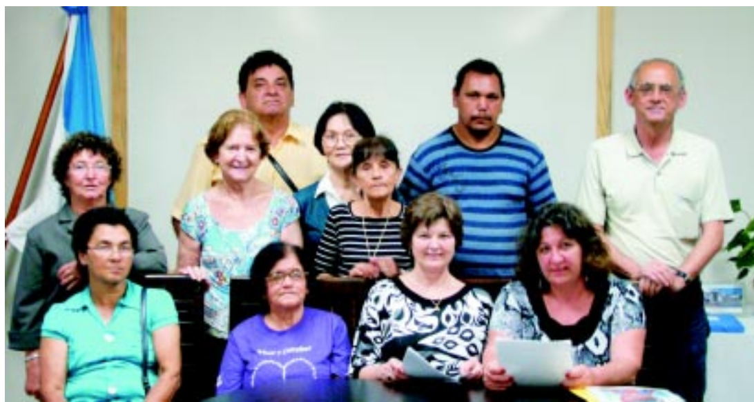
Os membros do Conselho Municipal do Idoso: posse aconteceu no dia 23/10