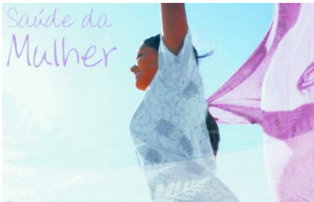
Campanha de prevenção contra o câncer de colo de útero começa no dia 14 em Capão Bonito