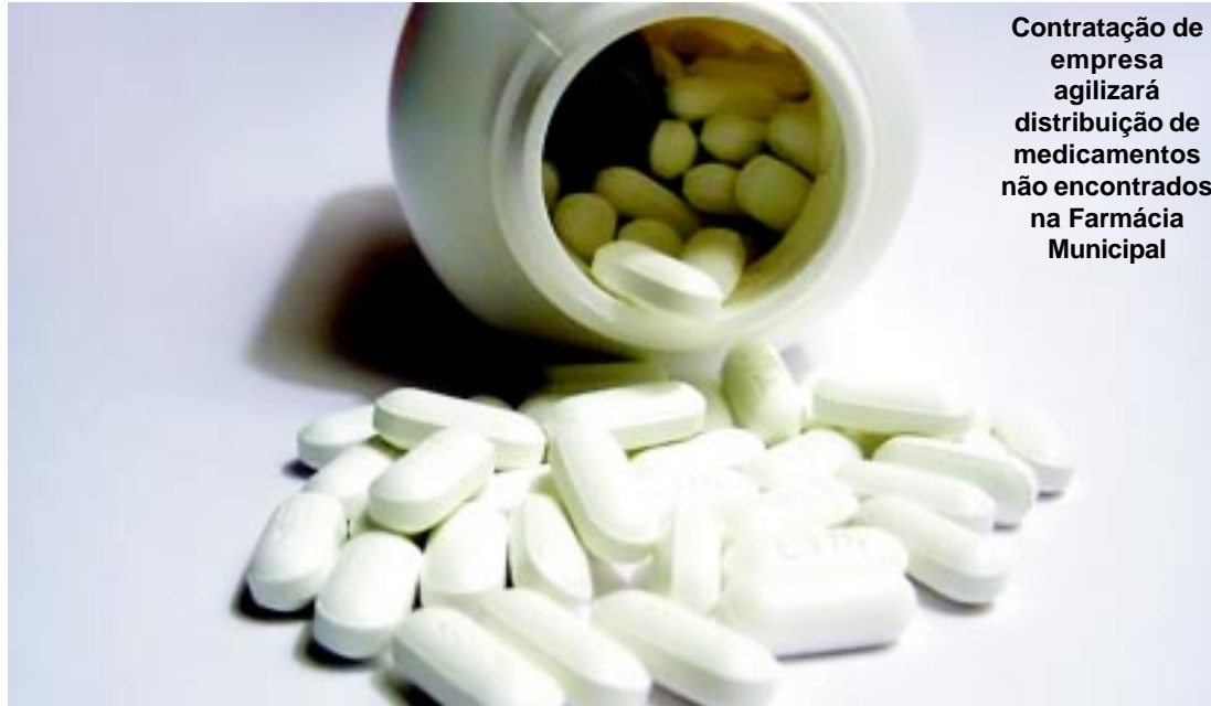
Contratação de empresa agilizará distribuição de medicamentos não encontrados na Farmácia Municipal

O valor estimado do contrato é de R$ 150 mil por um período de 12 meses.