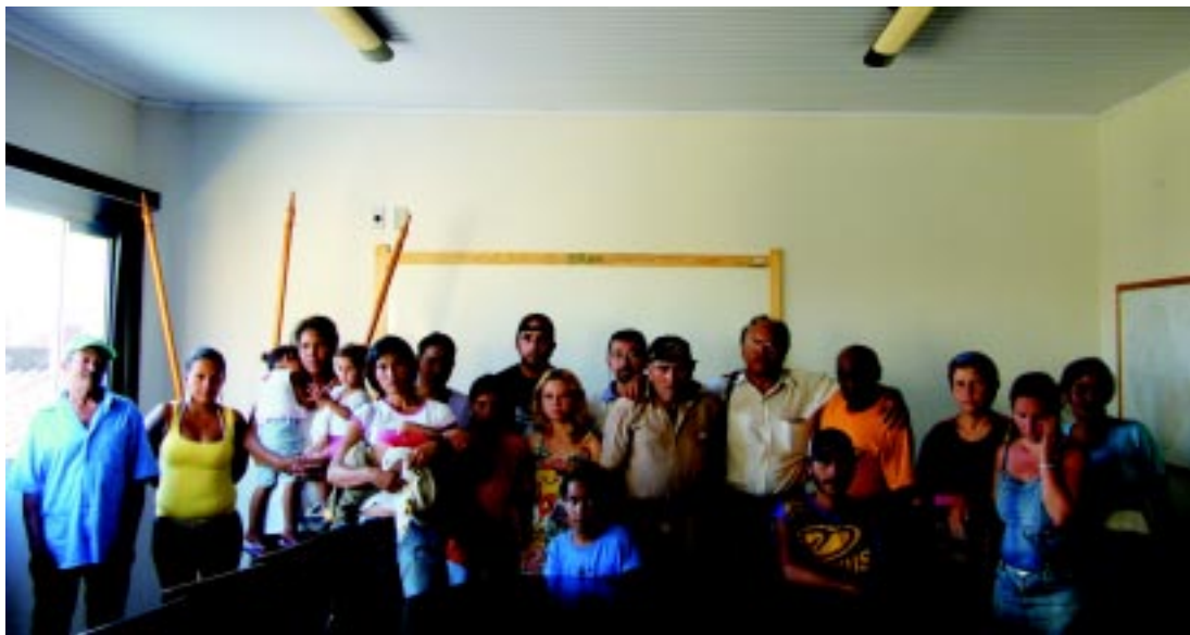
Assinatura de indicações e termos de compromisso na última terça-feira, 03/11

HABITAÇÃO - Foram assinados na última tarde de terça-feira, 03/11, novas indicações e termos de compromissos de várias pessoas para os conjuntos habitacionais da CDHU (Companhia de Desenvolvimento Habitacional e Urbano do Estado de São Paulo) em Capão Bonito.