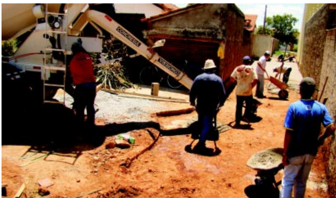
Melhoria do sistema de canalização e captação de águas pluviais evitará inundações