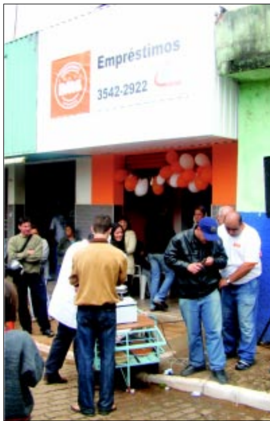
Posto Bancário do BMG na vila Aparecida

O BMG foi oito vezes eleito o Melhor Conglomerado Financeiro pela Fundação Getúlio Vargas, no segmento Financiamento ao Consumo. Pela terceira vez eleito o Melhor Banco em Financiamento ao Consumo pela Gazeta Mercantil / Austin Rating.