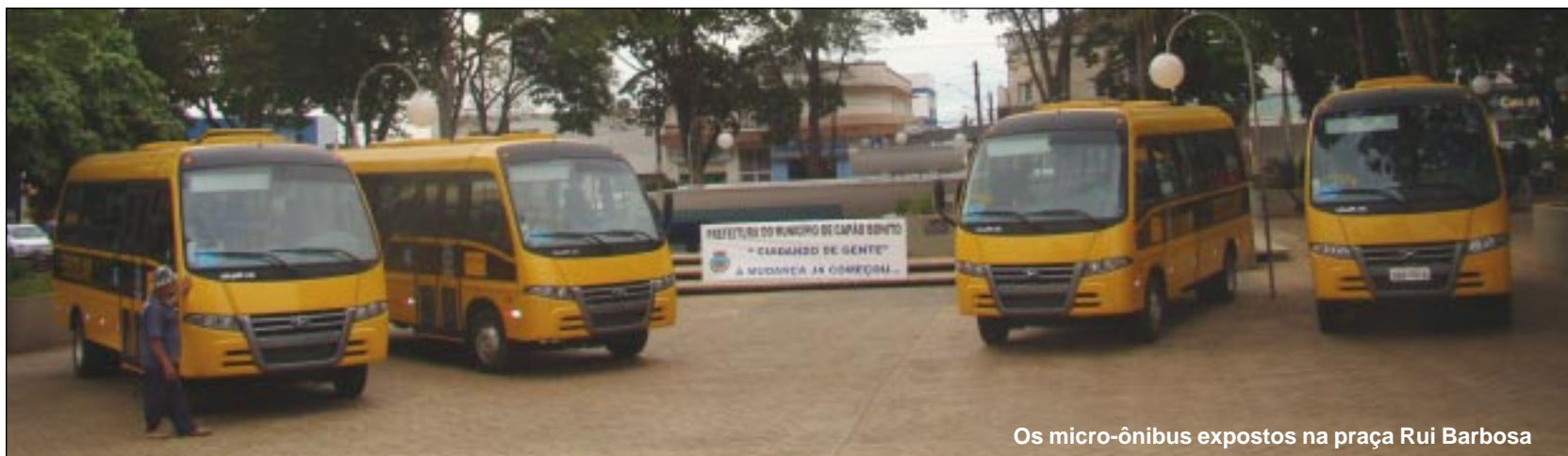
Os micro-ônibus expostos na praça Rui Barbosa

Prefeitura comprou mais três micro-ônibus pelo Programa Caminho da Escola