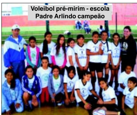
Voleibol pré-mirim - escola Padre Arlindo campeão