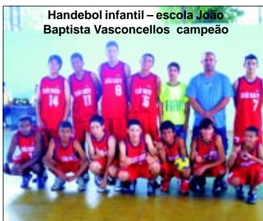
Handebol infantil – escola João Baptista Vasconcellos campeão