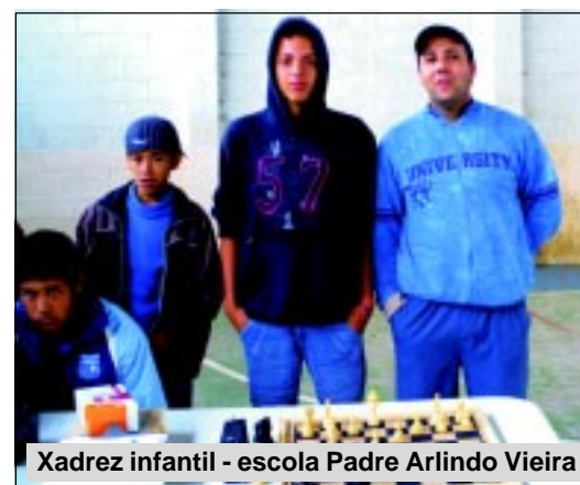
Xadrez infantil - escola Padre Arlindo Vieira