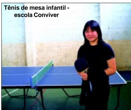
Tênis de mesa infantil - escola Conviver