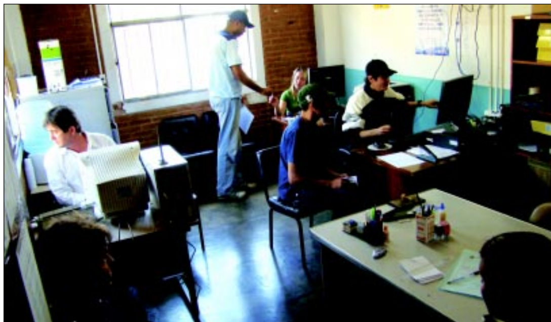
Posto de Atendimento ao Trabalhador de Capão Bonito: manual elaborado será utilizado pelo Emprega São Paulo

Comparando números do PAT de 2008 com 2009, o número de atendimentos chega ser cin-