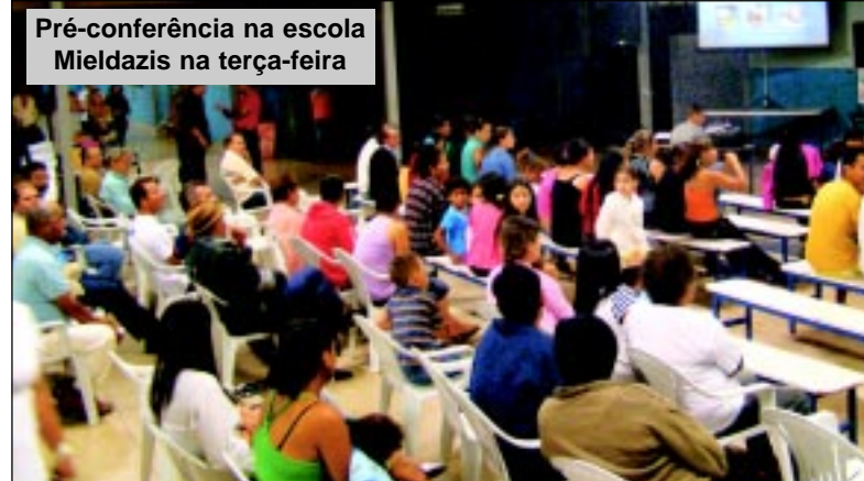
Pré-conferência na escola Mieldazis na terça-feira