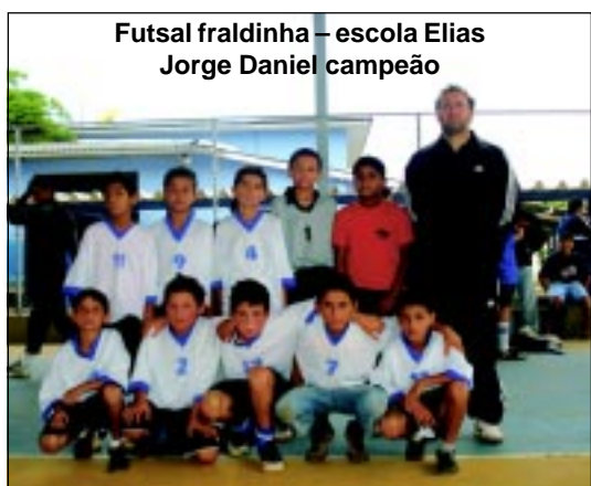
Futsal fraldinha – escola Elias Jorge Daniel campeão