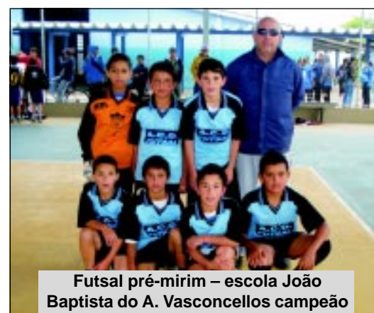
Futsal pré-mirim – escola João Baptista do A. Vasconcellos campeão