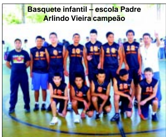
Basquete infantil – escola Padre Arlindo Vieira campeão