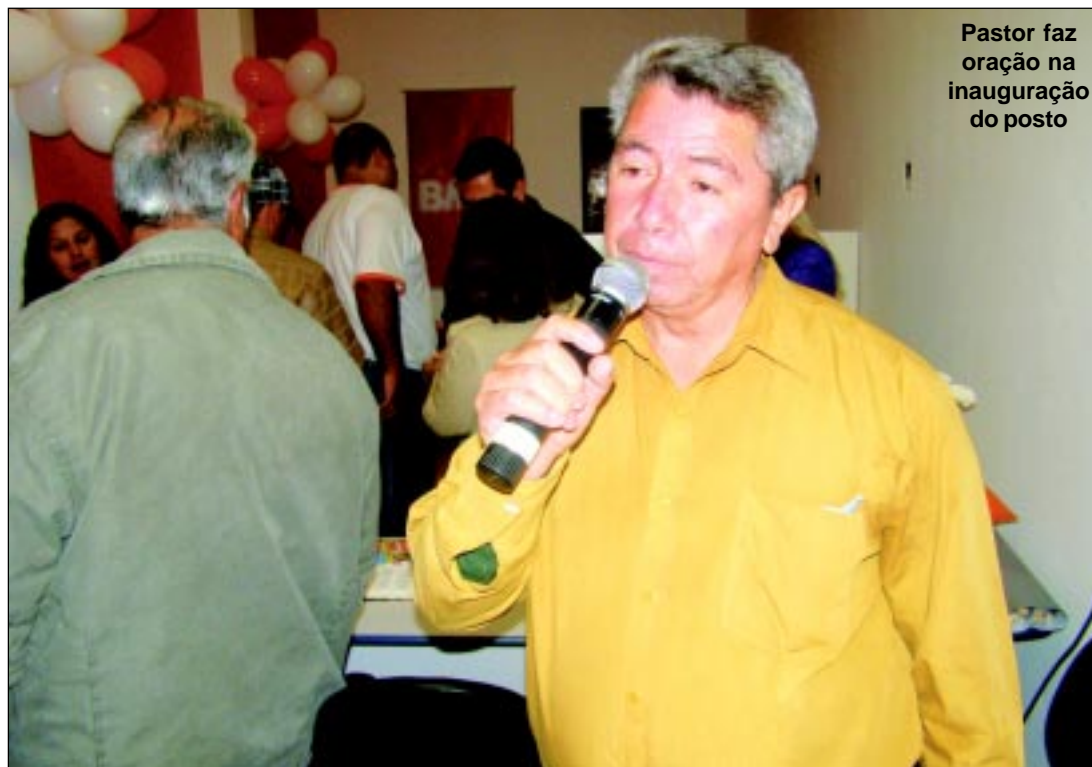
Pastor faz oração na inauguração do posto