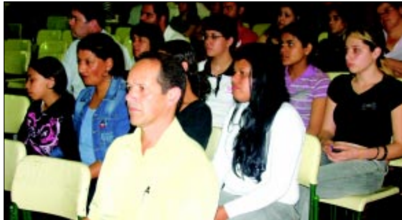
Pré-conferência realizada na escola Padre Arlindo Vieira na segunda-feira

Na próxima semana, as pré-conferências aconteceram às 19:30 horas no Distrito do Turvo dos Almeidas - dia 26 (segunda-feira) e Ana Benta - dia 29 (quinta-feira).