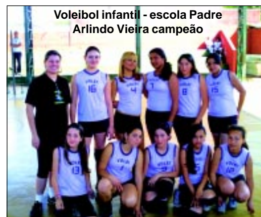
Voleibol infantil - escola Padre Arlindo Vieira campeão